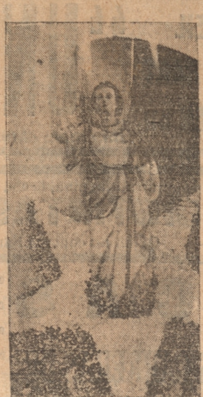
EL ANDA DEL ANGEL DE CHILE

Las instituciones católicas de estas parroquias iban con todos sus miembros y los estandartes respectivos. También iban los distintos colegios correctamente formados. Cada una de esas parroquias,