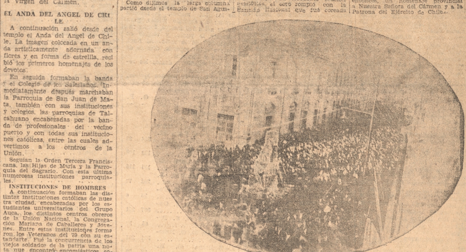
LA PROCESION PASANDO POR LA PLAZA DE ARMAS