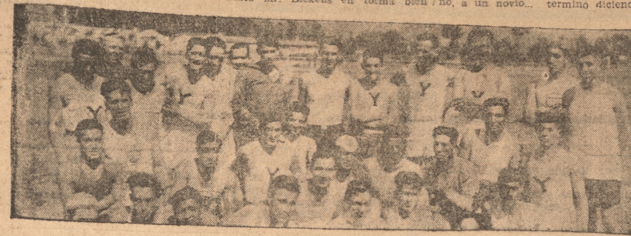
GRUPO GENERAL DE LOS ATLETAS PARTICIPANTES.

2.0 Hofer (Alem.) 17 1/8. 3.0 Miller (Alem.). 1.500 metros 1.0— C. Echeverría (R.) 4.28. 2.0— González (C.) 4.32 1/8. 3.0— Fuentetaja (Cochrane). 4.0— Cuitiño (A. C.).