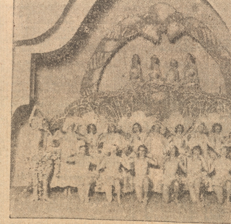
UN TABLEAU FINALE EN LA REVISTA "OIGA... OIGA" QUE SE ESTRENA HOY

En la matinee irá "Aromas de España", el espectacular estreno de anoche