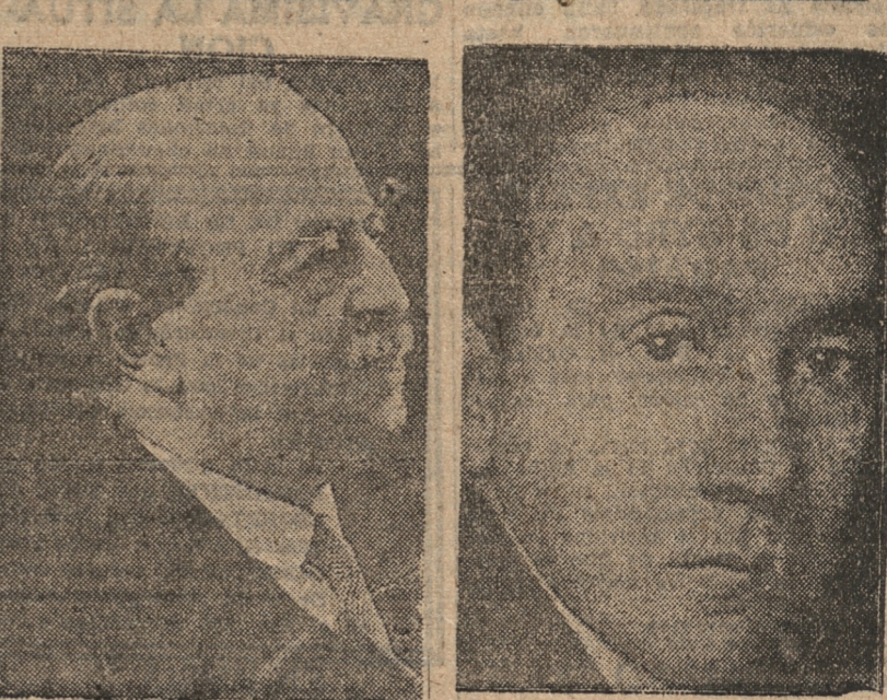
Excmo. señor Pedro Irigoyen, Embajador del Perú en Chile

Con el alboroz con que se reciben los grandes acontecimientos, celebra Lima el cuarto centenario de su fundación. La ciudad de los Virreyes, colonial y moderna, luce ahora junto al Rímac las mejores galas de su entusiasmo ante la fecha que conmueve también al continente. En el valle de aquel río que según el hablar quechua era murmurador, flameó un 13 de Enero, perdido ya en el correr de cuatro siglos, la bandera de Castilla que andaba conquistando tierras y la