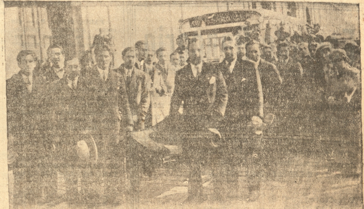
ALGUNOS DUEÑOS DE GONDOLAS D ESFILANDO