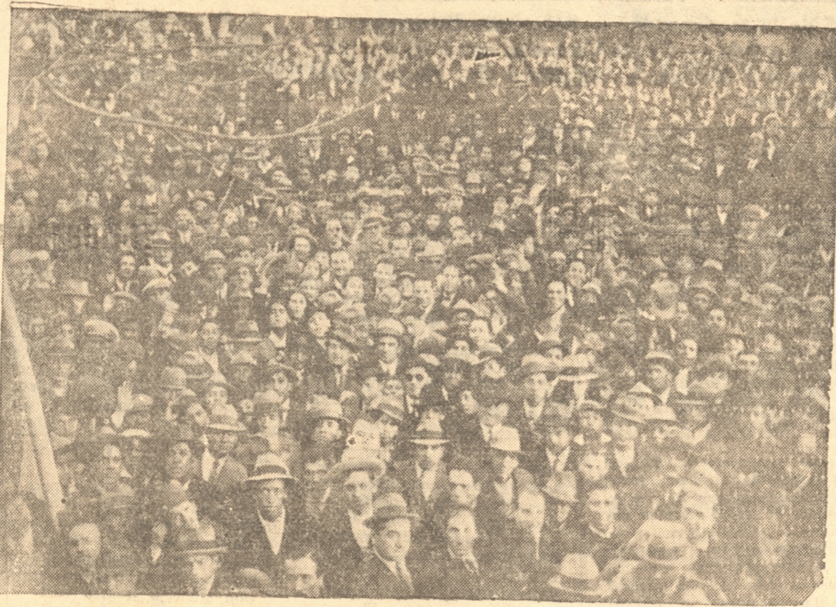
DURANTE LA ADHESION QUE LOS FERROVIARIOS TRIBUTARON AL GOBIERNO