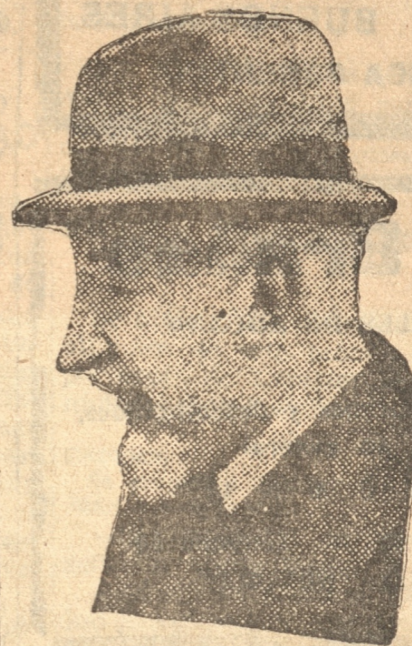
Don Carlos Balmaceda, Ministro de Relaciones Exteriores, Tierras, Comercio y Colonización

Hoy creo, con la misma serenidad que con ayer cumplí el otro, dentro del correcto funcionamiento de las disposiciones constitucionales, adoptar esta resolución, en la seguridad de que entrego la paz pública, al cuidado de un ciudadano eminente, lleno de prudencia y patriotismo. Pido a todos mis conciudadanos que se presenten su adhesión". — (Fdo). — PEDRO OPAZO LETELIER.