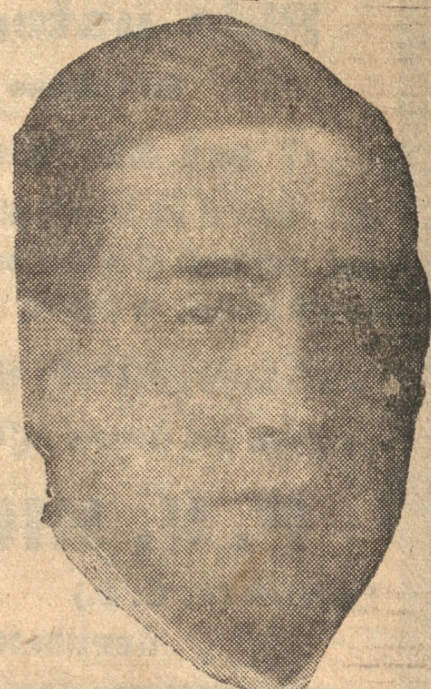
Don Luis Gutiérrez, Ministro del Interior

SANTIAGO, 27.— "La Nación", publica un párrafo que dice que se publicará sólo provisoriamente, pues el Gobierno no necesita un diario en vista de que desea que sus actos estén sujetos a la