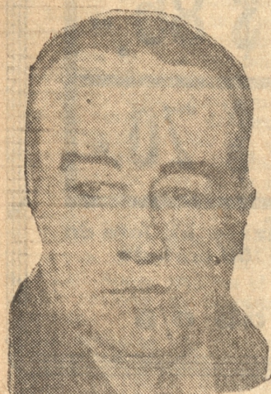
Don Juan Esteban Montero, Nuevo Vice-Presidente de la República

Todas las actividades quedarán completamente reanudadas en el día de hoy