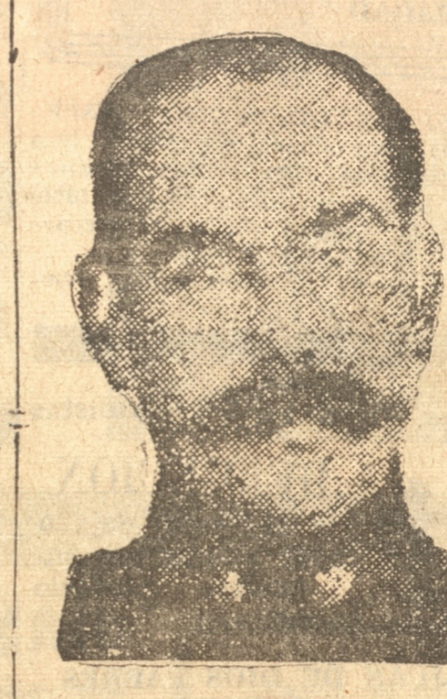
General don Carlos Sáez, Ministro de Guerra