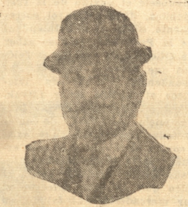
Don Pedro Opazo Letelier, que resignó ayer sus funciones de Vice-Presidente

El señor Luis Gutiérrez Alliende, Ministro de Justicia, pasa a desempeñar el Ministerio de lo Interior.