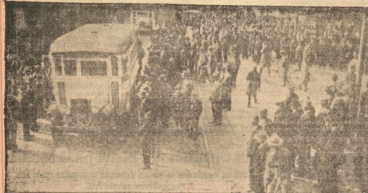
VISTA PARCIAL DEL DESFILE DE LAS GONDOLAS

"No ha podido el Cuerpo Médico dejar pasar este triunfo en el cual tomara tan amplia parte, sin hacer público su más puro regocijo.