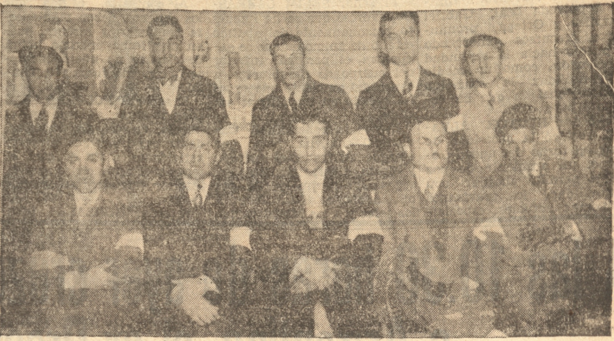
LA GUARDIA CIVICA UNIVERSITARIA QUE RECORRIO LAS CALLES DE CONCEPCION RECOMENDANDO AL PUEBLO PAZ Y CORDURA

Terminada esta manifestación los desfilantes se dirigieron con todo orden hacia la estación de los Ferrocarriles donde se disolvió el desfile.