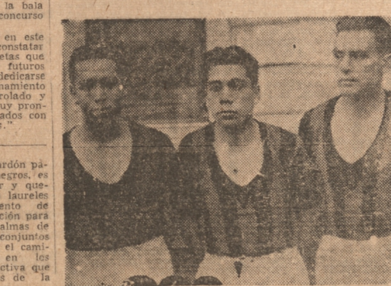
Aquí tenemos antes del match a los jugadores del Torneros de Taleahuano que actuaron ayer. Son ellos, el ágil Solo que no actuó conforme a su clase y antecedentes; luego a Leiva, elemento nuevo de los aguerridos portenos y a Piuo que fué uno de los grandes defensores del team porteno que cayó ayer derrotado por el Cochrane.