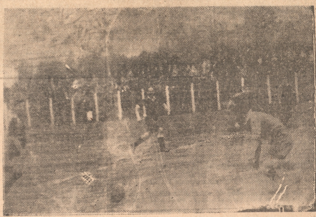
A PESAR DEL MAL DÍA de ayer, poco apropiado para los match incipientes del futbol podemos ver una del lance entre Fernández Vial y Victoria de Chile, jugado ayer en la cancha Collao y en la que ganó Vial por seis a dos.