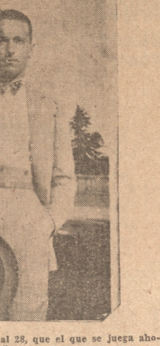
Fué superior el fútbol de 1918 al 25, que el que se juega ahora

El último Congreso de Atletismo, celebrado en Buenos Aires, se consideró un punto de gran importancia, cual es el que se refiere a las condiciones de salud y vigor físico de los atletas.