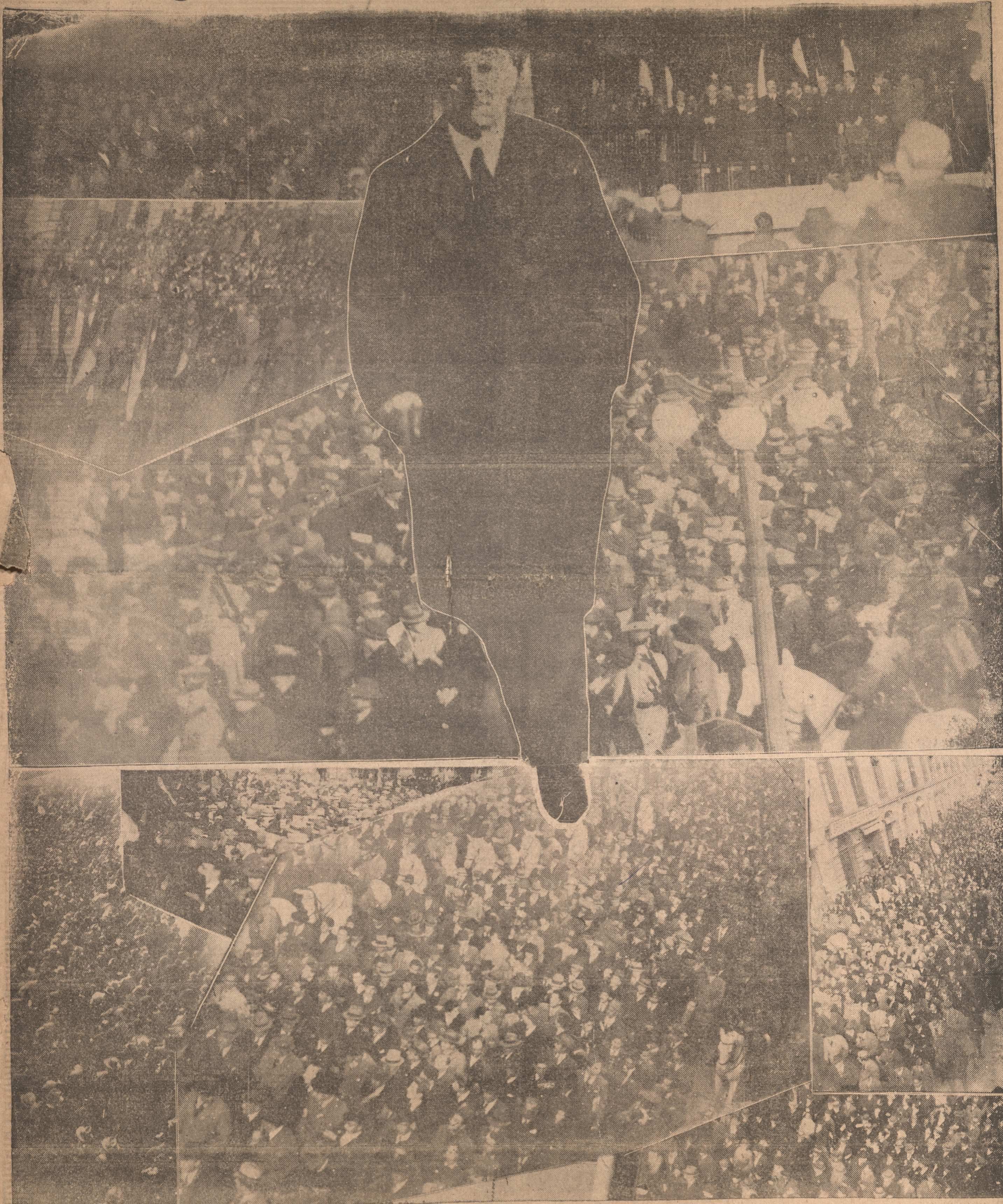
A TRAVES DEL MOSAICO PUEDEN APRECIARSE LAS PROPORCIONES GRANDIOSAS QUE REVISTO EL RECIBIMIENTO QUE CONCEPCION TRIBUTO AYER AL CANDIDATO NACIONAL A LA PRESIDENCIA DE LA REPUBLICA, DON GUSTAVO ROSS SANTA MARIA. — POCAS VECES NUESTRA CIUDAD PUDO PRESENCIAR UN ACTO CIUDADANO DE LA MAGNITUD DEL DESARROLLADO AYER. — EN ESTAS FOTOS APARECEN ASPECTOS DE LA LLEGADA DEL CANDIDATO, DE LA PROCLAMACION EN EL TEATRO CENTRAL Y DEL BANQUETE