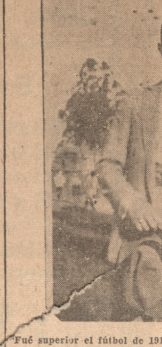
Fué superior el fútbol de 1918 al 25, que el que se juega ahora