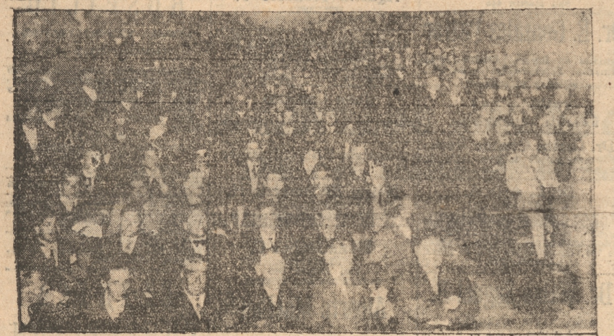
ASPECTO DE LA SALA DE LA CONVENCION

HOY HABRA SESION A LAS 9 HORAS Hoy, a las 9 de la mañana, se reunirá nuevamente los convencionales en el local de los Baños Talcahuano.