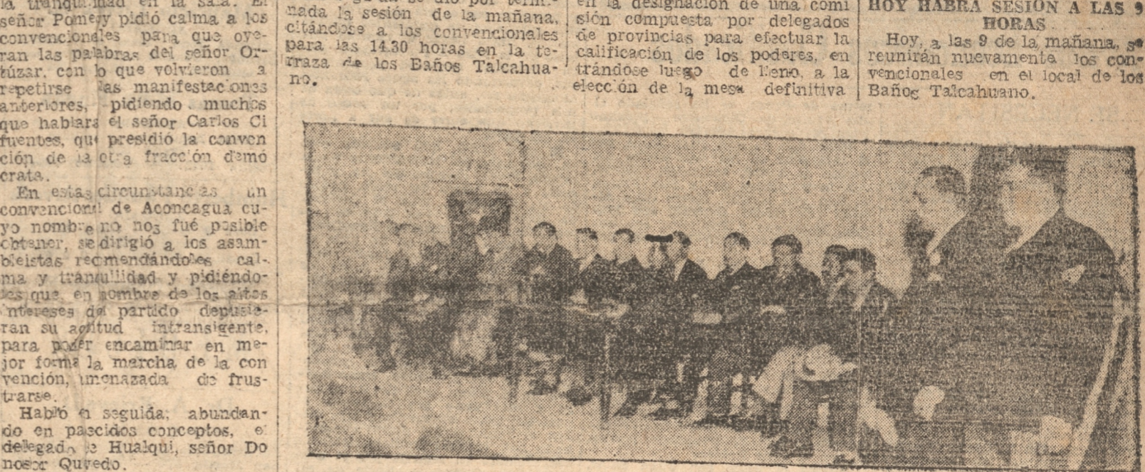
LA MESA PROVISORIA EN LA SESION INAUGURAL