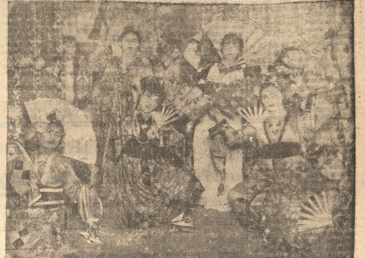
LAS ALUMNAS DE LA PROVINCIA QUE PARTICIPARON EN LA DANZA DE LAS "JAPONESAS" QUE MERECIO ESPECIALES APLAUSOS DE LA CONCURRENCIA