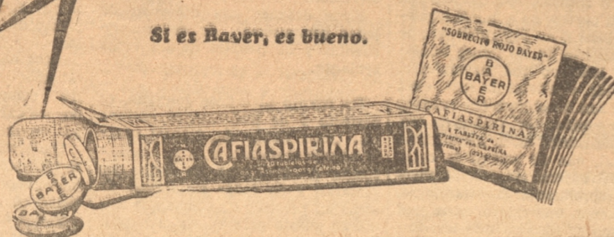
CAFIASPIRINA (M.R.) Eter compuesto etánico del ácido orto-oxibenzoico con Cafeína