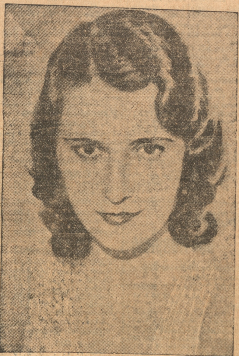
BARBARA STANDWICK, UNA DE LAS ACTRICES QUE HA IM PUESTO EN FORMA MÁS DE UN AÑO SU TEMPERAMENTO