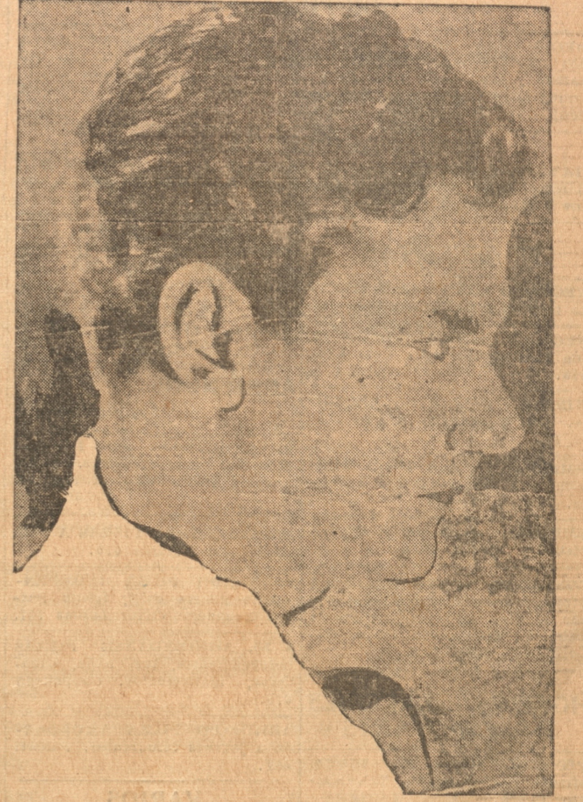
JOEL MC CREA, ELEMENTO DEL CINE QUE EMPIEZA A FILAR SUS CONDICIONES EXCEPCIONALES EN DIVERSOS ESTU DIOS