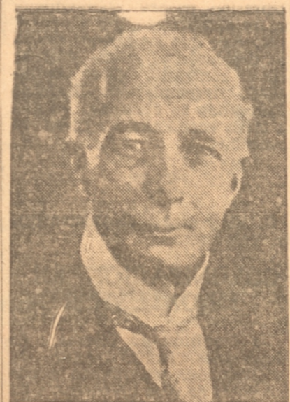
MR. SIDNEY W. PASCALL, Presidente del Rotary Internacional.

"Esta Conferencia ha puesto de manifiesto la fuerza moral de Rotary, ya que en ella, a más de problemas de carácter interno, tendientes a dar mayor desarrollo al concepto y espíritu rotario, se han tratado problemas de capital importancia para el país y se han afrontado las situaciones porque atraviesa Chile. En general, se tiende a normalizar la acción de todas las actividades, que seguramente se traducirán en una mayor confianza para solucionar los problemas de actualidad.