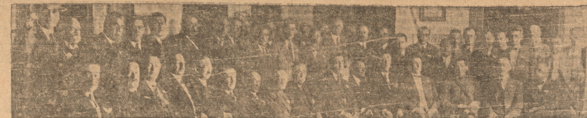
GRUPO GENERAL DE LOS ASISTENTES A LA V CONVENCION DEL DISTRITO 64.

Después de una ardua labor, se clausuraron anoche las actividades de esta conferencia. — Se aprobaron interesantes conclusiones. — La próxima Convención anual se efectuará en Magallanes. — Nuevos e interesantes trabajos leídos en las sesiones de la mañana y de la tarde. — Las visitas que harán hoy. — Declaraciones hechas a LA PATRIA por algunos delegados