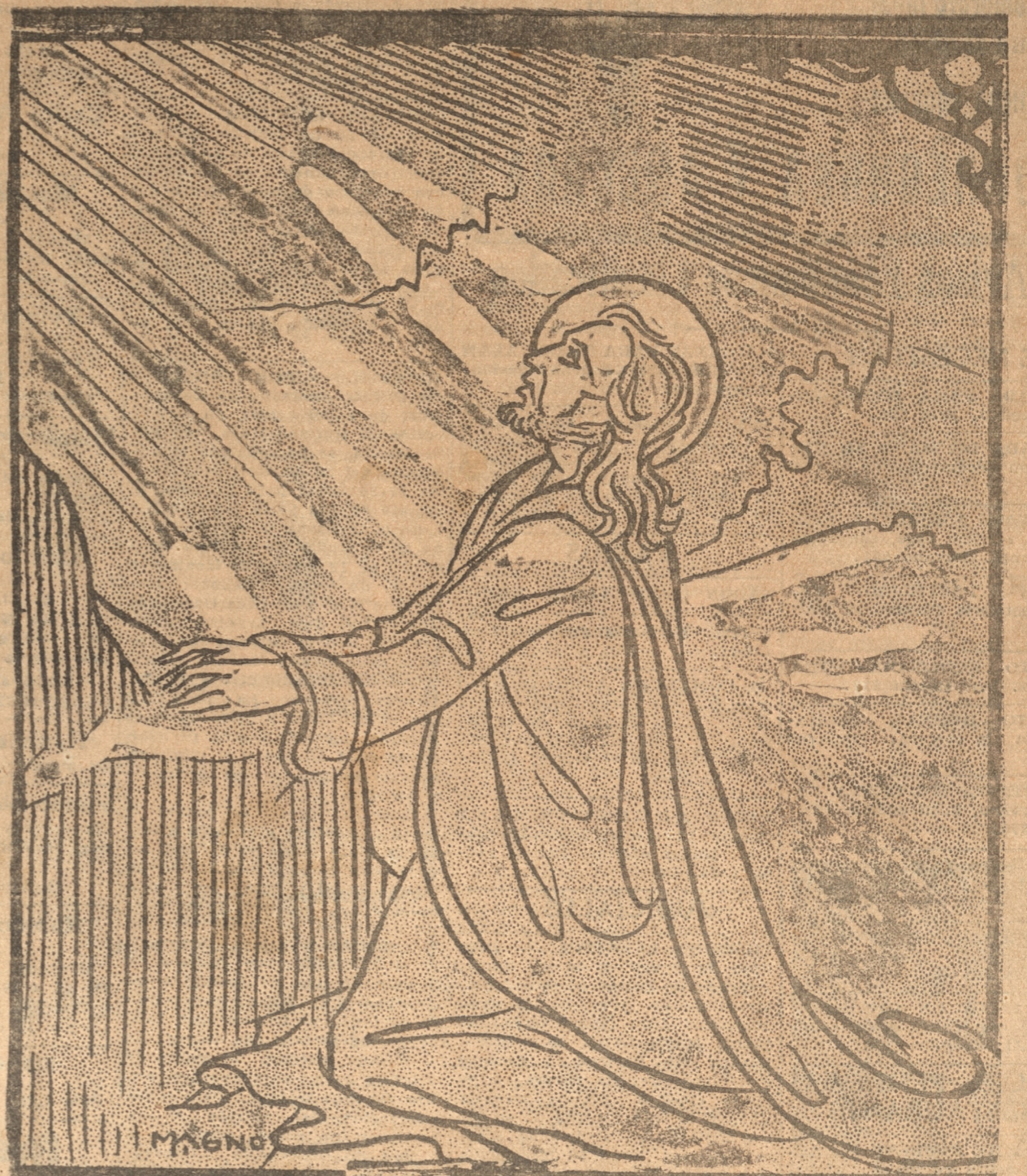
LA ORACION EN EL HUERTO

Hoy Jueves Santo está consagrado por la Iglesia Católica a conmemorar la institución del Santo Sacramento de la Eucaristía, el misterio por excelencia de la Real Presencia Divina en las humildes especies del pan y del vino.