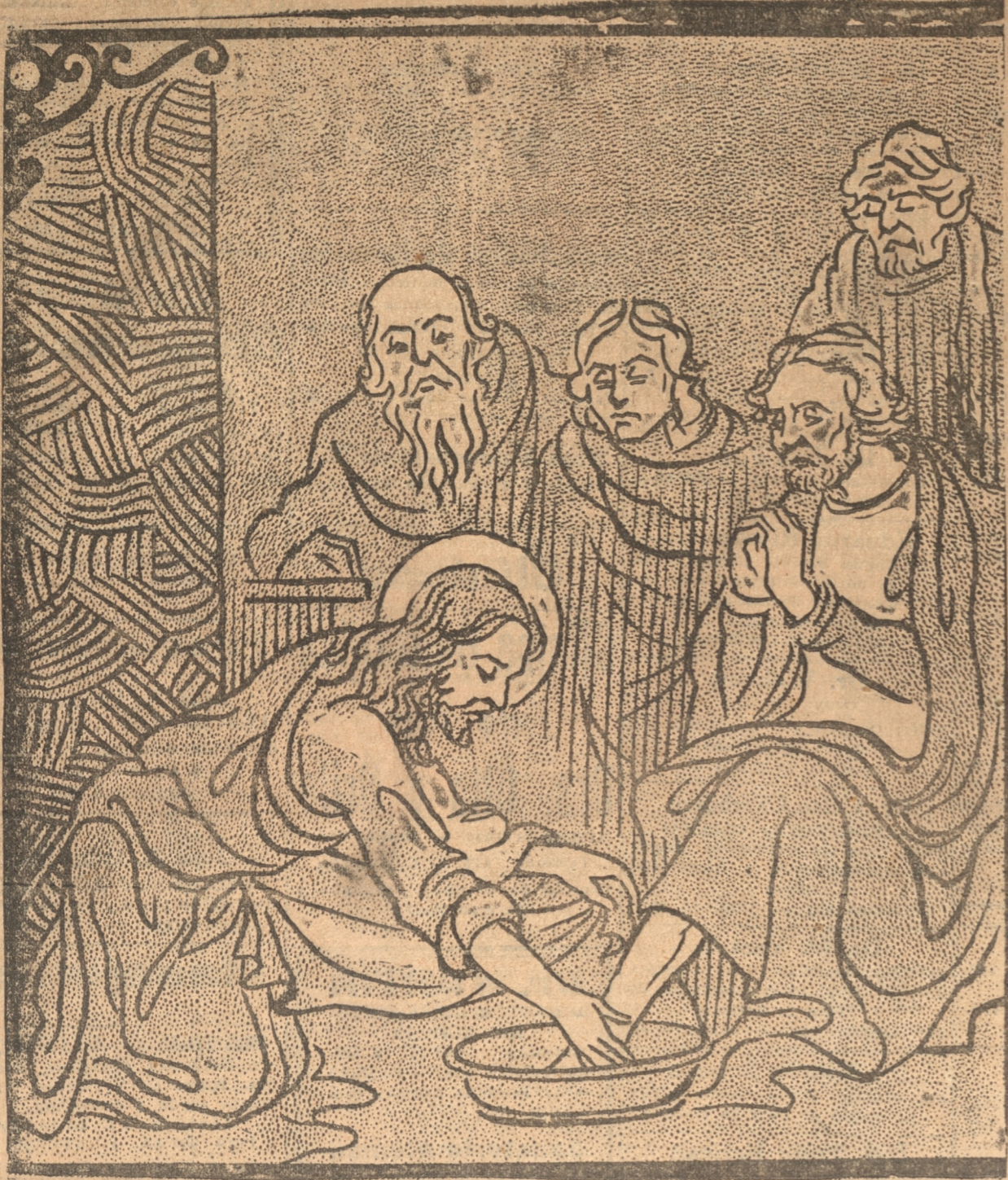
EL LAVATORIO DE PIES