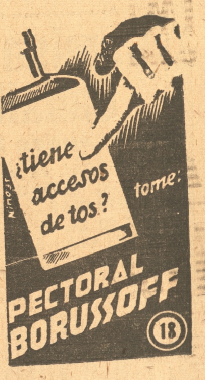
Base: Bromoformo Codeina

Los representantes de los barrios Pedro del Río y Pedro de Valdivia, se comprometieron a trabajar decididamente para afianzar el proyecto, recogiendo firmas, enviar comunicaciones especiales a los parlamentarios y efectuar todo lo que sea necesario para afianzar esta obra de efectivo adelanto para esos barrios la ciudad y la región en general.