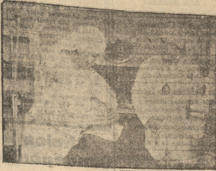
Durante una curación dental a un niño

agregarse diversos cursos y otras actuaciones de carácter benéfico, a las cuales, en ningún momento la institución han negado su concurso. Como lo hemos dicho, en el día de hoy se clausuraron las actividades del Policlínico, por el período de dos meses, pero siempre continuará funcionando la sección hospital de la misma institución a que nos vamos refiriendo. Terminado el plazo indicado, continuarán de nuevo las actividades de este policlínico, un plan