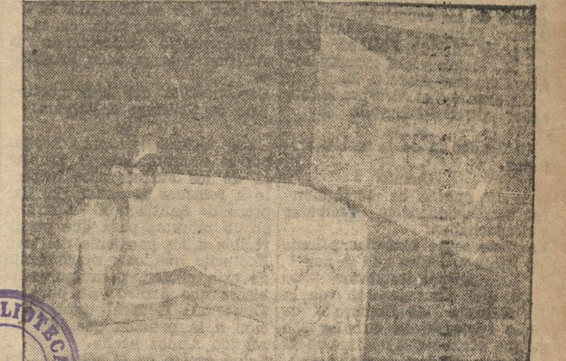
Un niño en el tratamiento de rayos ultra-violeta

ma bastante módica, y por lo cual no es de dudar que asistirá en un cercano momento. Se invita especialmente a la inauguración del salón a los señores redactores de los diarios de la localidad "LA PATRIA" y "El Sur".