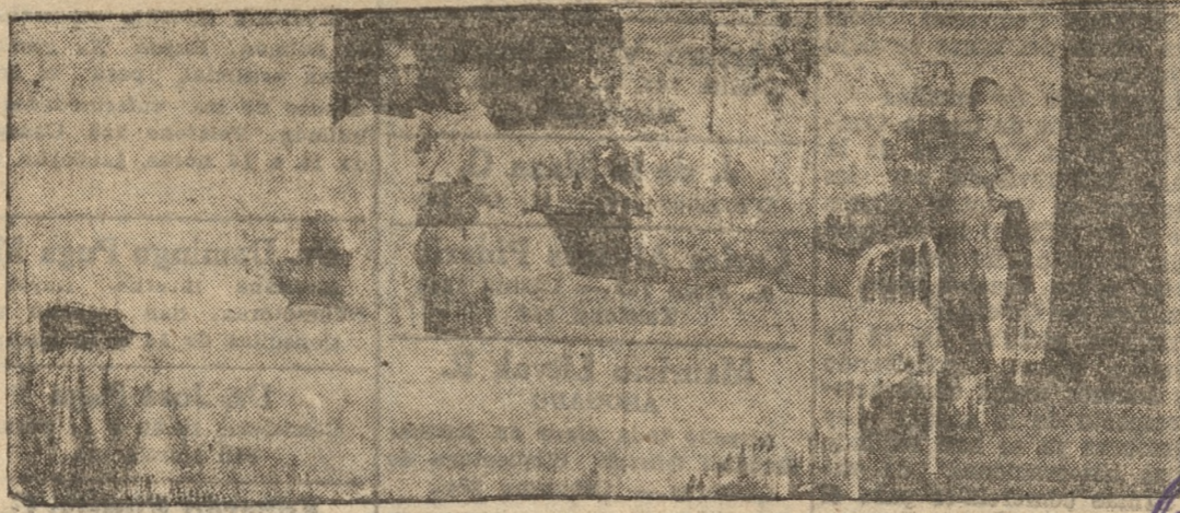
LA SALA DE GUAGUAS DEL POLICLINICO