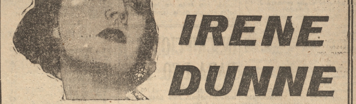
La hermosa y seductora estrella que interpretó LA USURPADORA — y el severo y varonil astro.

HE AQUÍ POR PRIMERA VEZ JUNTOS EN UNA HERMOSA PELICULA A LOS PRINCIPIES DE LA PANTALLA.