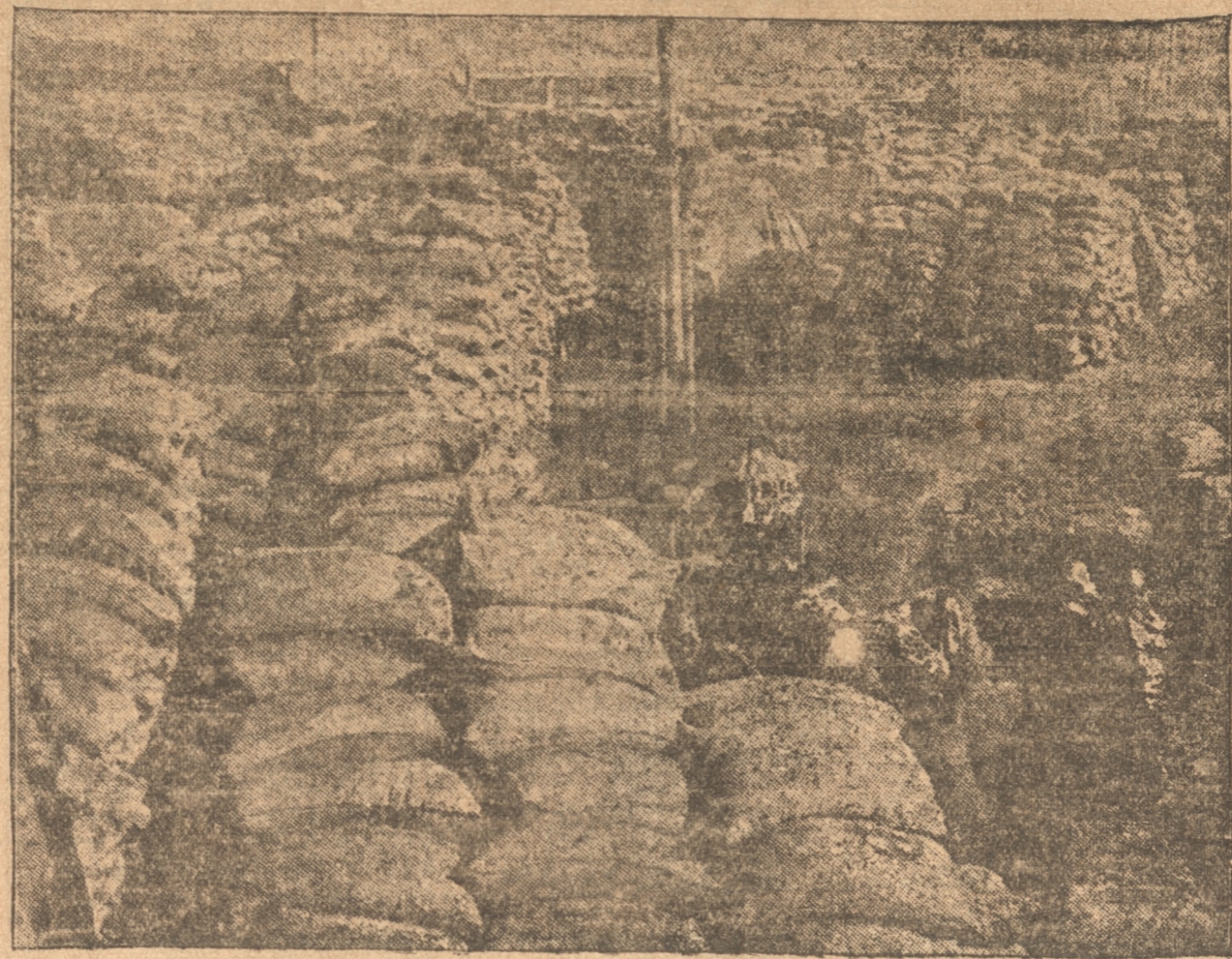
PILAS DE BOLSAS DE POROTO S AMONTONADAS EN UNA ESTACION DE MANCHURIA, A LA ESPERA DE SER EXPORTADAS

Existen más de 500 instituciones molineras en Manchuria, de toda escala y construcción, yendo desde