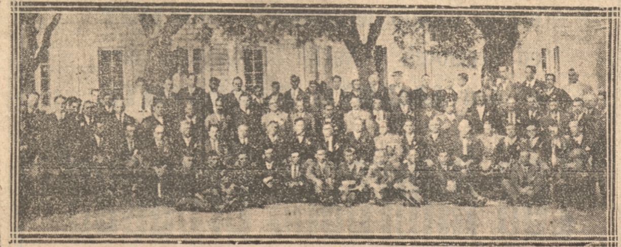
GRUPO GENERAL DE LOS CONVENCIONALES

vicios, tanto por lo que toca al Fisco como a las Municipalidades. 2.º Si esto no tuviera cabida por una incompleta manifestación de Leyes y Reglamentos vigentes que informan dichas materias, arbitrar los medios del caso para la presentación de un proyecto de ley que aclare la cuestión.