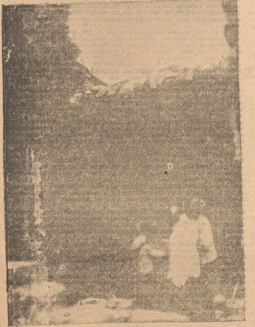
COMO QUEDO LA MURALLA DESPUES DEL DERRUMBE