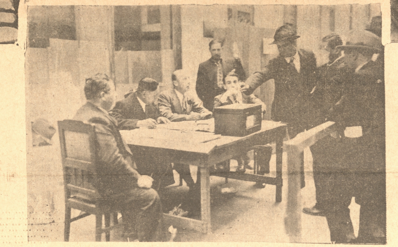
DIVERSOS ASPECTOS OBTENIDOS DURANTE EL FUNCIONAMIENTO DE LAS MESAS RECEPTORAS DE SUFRAGIOS, EN NUESTRA CIUDAD

gado el 60 por ciento del electorado en forma tranquila. En Puerto Montt también hay tranquilidad. En San Bernardo un nacista trató de arrojar una bomba lacrimígena sobre el presidente departamental conservador, pero falló en su intento. En Valparaíso hay más o menos treinta personas detenidas por provocar desórdenes y arrojar bombas. También hay 22 mujeres detenidas por ser sorprendidas de obstaculizar la libertad de sufragio. En La Serena un individuo disparó un balazo sin consecuencias, siendo detenido inmediatamente. Datos inconformados dan los siguientes cómputos en provincias: ANTOFAGASTA. — Aguirre 11.311, Ross 4.885. — ARAUCO. — Aguirre 2.314, Ross 2.271. — SANTIAGO RURAL. — Aguirre 3.548, Ross 6.641. — O'HIGGINS. — Aguirre 2.313, Ross 5.169. — COLCHAGUA. — Aguirre 1.681, Ross 5.136. — CURICO. — Aguirre 1.358, Ross 2.709. — CONCEPCION. — Aguirre 13.984, Ross 6.426. — SIBULE. — Aguirre 5.800, Ross 11.030. — LINARES. — Aguirre 1.774, Ross 4.497. — MAGALLANES. — Aguirre 3.993, Ross 425. — CHILE. — Aguirre 1.764, Ross 1.079. — ATACAMA. — Aguirre 4.830, Ross 2.574. — VALDIVIA. — Aguirre 10.177, Ross. — 7.389. — CAUTIN. — Aguirre 13.041, Ross 12.143. COMUNA DE BARRANCAS: Ross 608, Aguirre 120. — COMUNA DE LA FLORIDA: Ross 534, Aguirre 68. — LAS CONDES. — Ross 644, Aguirre 577. — Falta una mesa. COMUNA DE VALDIVIA. — Ross 1.636, Aguirre 2.952. — CORRAL. — Ross 320, Aguirre 357. — LOS LAGOS. — Ross 509, Aguirre 494. — TALAGAN-