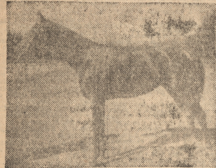
La pupila del Stud Porvenir hizo emplearse a fondo el domingo a Ardeur, obligandola a dividir el premio en el clásico C. H. Santiago