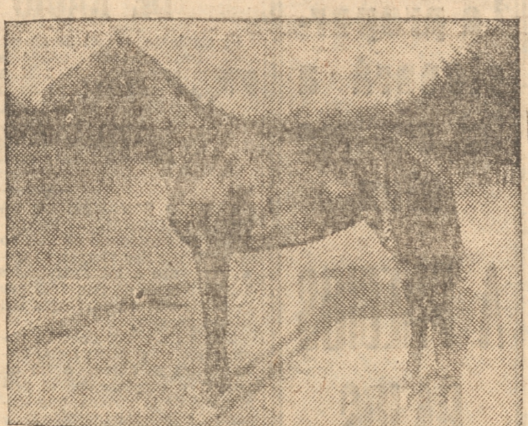
La chicoca ARDEUR dió muestras el domingo de la gran razón para la lucha al defenderse bravamente del ataque de Aut-o-pep en los tramos finales del clásico