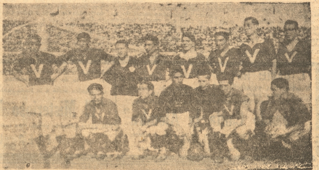
Aquí tenemos el equipo campeón amateur de Chile, el once de Valparaíso, que obtuvo tan honrosa clasificación después de ganar estrechamente al equipo de nuestra zona y por goleada en el decisivo, a Valdivia. Valparaíso, la cuna de todos los deportes en Chile, vuelve por sus fueros. Nos alegramos por los portieños y por el deporte, pues con esta victoria, Valparaíso cobrará nuevos bríos y seguirá dando en las lides deportivas nuevos campeones y más brillo al deporte nacional. Bien, portieños!

No hay nada que decir: a esto se agregó la bien condimentada y abundante comida a cargo de constantes maestras en el arte culinario que, como todos más que satisfechos, en las últimas horas de la tarde regresaron los lorenses de su paseo.