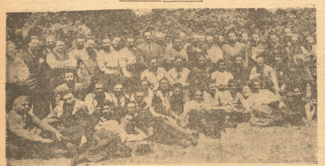
Grupo general de asistentes al paseo efectuado ayer por el prestigioso club Lord Cochran

En medio del mayor entusiasmo y conforme estaba anunciado, ayer se efectuó el paseo con que el Lord daba término a las fiestas con que ha venido celebrando el 22 aniversario de su fundación. Este paseo, como su nombre indica, resultó un gran éxito, tanto por el desfile de alegría y buen humor de que hizo gala, como por el grupo general de asistentes de la casa verde, con quienes se realizó una fiesta admirablemente para el momento.