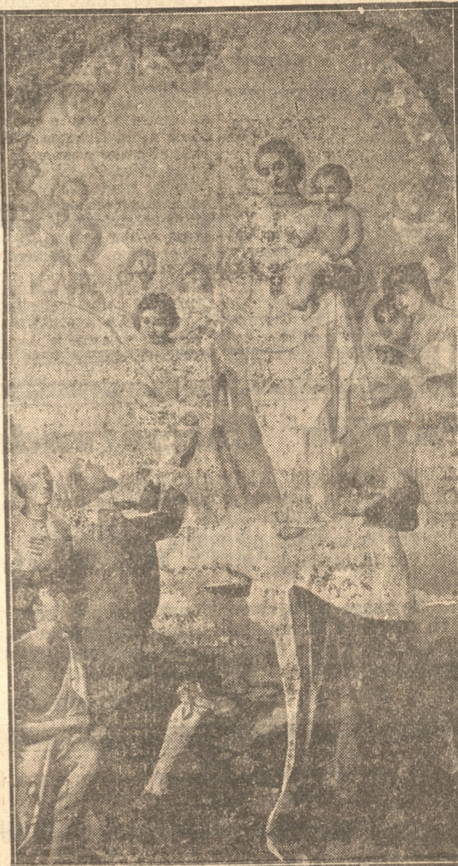
La Virgen de la Merced, en su fiesta se celebra hoy en la Parroquia de su nombre, en su Descensión a fundar la Orden de la Merced

En la tarde, a las 15 horas, se hará la consagración de los niños, a la Sma. Virgen de la Merced. Se ruega a las madres traigan a sus hijos a esta ceremonia. El mes de la Virgen sigue rezándose con toda solemnidad hasta el domingo 27 día de la clausura que se rezará después de la tradicional procesión de la Virgen de la Merced y que este año revestirá el carácter de rogativa pública para implorar los auxilios de la Divina Providencia en las graves y actuales necesidades de nuestra Patria. En la distribución de esta tarde del mes, predicará el M. R. P. Antonio Zapata.