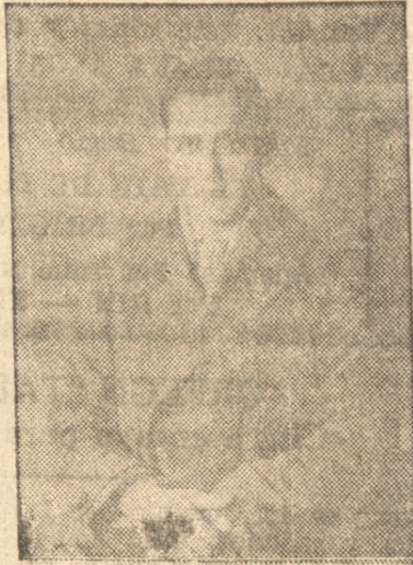
MEECH, el buen jugador visitante

Gran interés ha despertado en la afición, el encuentro de basket-ball que esta noche deberán sostener en la cancha del Liceo Alemán, Castellón 57, los teams representativos de la Escuela de Medicina de Santiago y Universitario de esta.