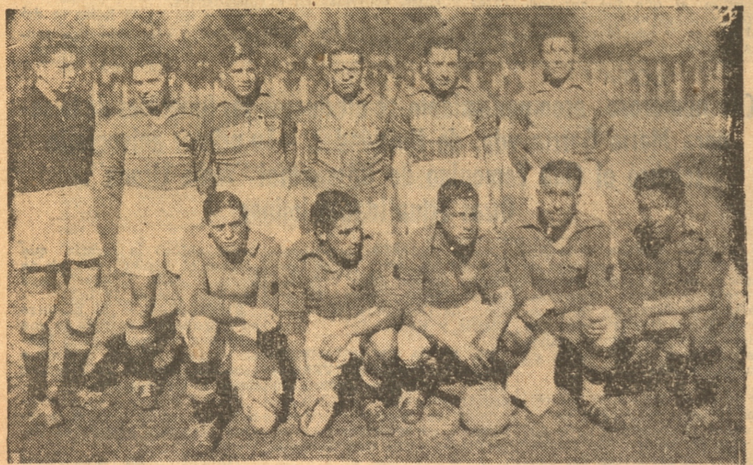
El formidable cuadro del Gold Cross de Talcahuano que juega mañana en esta ciudad con el Lord Cochrane de Concepción.

ra la reunión de fútbol de mañana en la cancha Collao. A la primera hora los cuadros infantiles del Gold Cross y del Lord Cochrane y a la segunda un match por la Copa Almirante Gerken, entre los equipos de los Lustrabatos de Concepción y de Talcahuano que ya han empatado dos veces. Habrá banda. Para la reunión de mañana