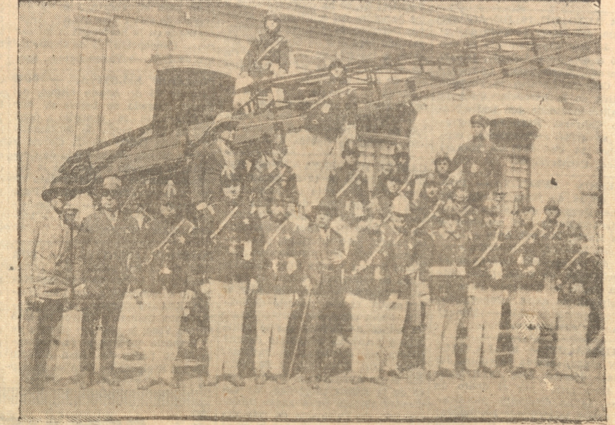
GRUPO DE VOLUNTARIOS DE LA 2.ª Cía. BOMBEROS