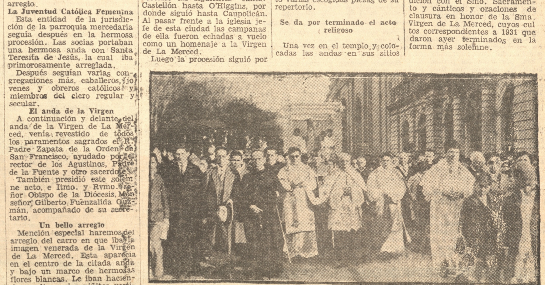
LAS AUTORIDADES ECLESIASTICAS EN EL DESFILE