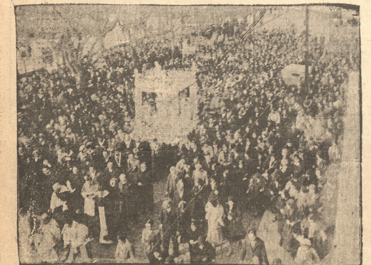
EL ENORME NUMERO DE FIELES QUE ASISTIO A LA PROCESION