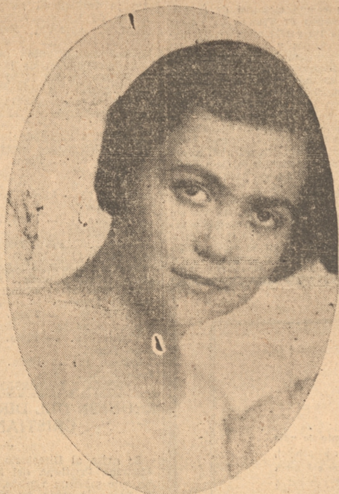
S. M. María II, Reina de las Fiestas primaverales de este puerto

EL NUMERO PRINCIPAL DE ESTA NOCHE LO CONSTITUYE LA FARANDULA. LA REINA HABLARA POR LA RADIO CULTURA A LAS 21 HORAS. PROGRAMA GENERAL QUE SE DESARROLLARA