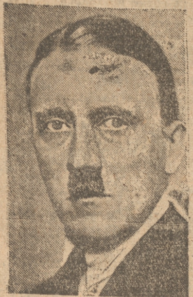
ADOLF HITLER, sobre cuyo mandato debe pronunciarse el pueblo alemán

UN DISCURSO PRONUNCIADO EL DOMINGO POR HERR GOEBBELS.— EL MINISTRO HESS EXPRESO EN UN DISCURSO QUE "HITLER HA NACIDO PARA GOBERNAR Y ES EL LLAMADO A SER EL JEFE".— EL VIERNES HABLARA HITLER POR RADIO A TODA LA REPUBLICA.— ACTUALMENTE ESTA PASANDO CORTAS VACACIONES EN LAS MONTAÑAS DE BAVARIA