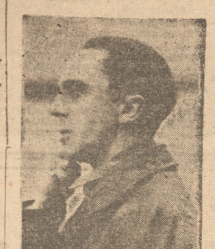
MINISTRO DE Propaganda Herr Goebbels que inició la campaña preparatoria del plebiscito

AGREGÓ JUEGO: "La nación ha colocado a su líder ya cansado por los años en el sitio en el que le corresponde descansar, con esto se ha puesto término a una época de la historia alemana. La hostilidad del mundo tenía fija sus esperanzas en la Muerte del Mariscal von Hindenburg, ellos esperaban que esto precipitara la crisis del nazismo. Nuestros adversarios que pusieron vanas esperanzas en un desacuerdo entre los líderes del nazismo, se verán desilusionados, porque nuestras labores son tan intensas que no podemos malgastar nuestras energías en desacuerdos internos. Los extranjeros tienen muy buenas razones para preocuparse del bolcheviquismo en sus propias casas; en Alemania el bolcheviquismo ha pasado a ser sólo una leyenda".