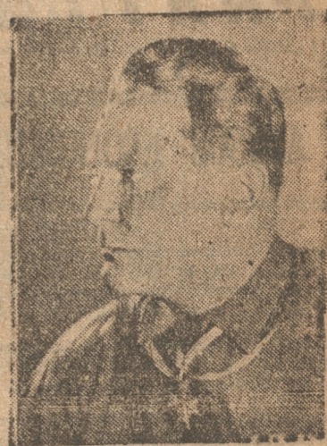
MINISTRO herr Hermann Goering, encargado de la propaganda en el Sur de Alemania

Es probable que a fines de la semana se terminen los estudios de la nueva organización administrativa de los servicios del Ministerio de Educación.