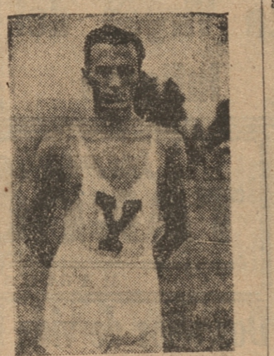
MARIARTE, el notable saltador penquista.

Los cinco mejores elementos de cada prueba que actuaron en el Estadio de la Avenida Collao