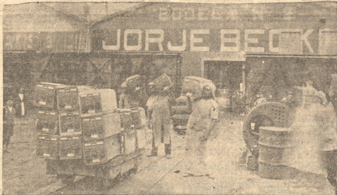
LOS CARGADORES LLEVANDO LAS MANZANAS HACIA EL MUELLE

El esfuerzo de la Cooperativa Frutícola del Sur, es digno de mencionarse ya que se ha sobrepuesto a la crisis agrícola