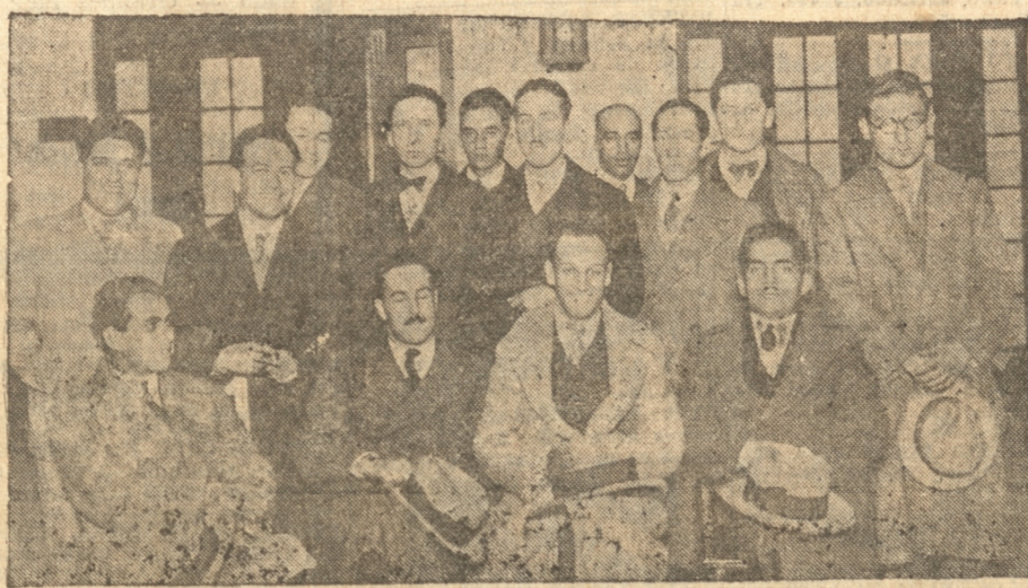
LOS PRESIDENTES DE LOS CENTROS UNIVERSITARIOS MOMENTOS DESPUES DE LA REUNION QUE CELEBRARON EN "LA PATRIA"

El Presidente dió cuenta de la reunión celebrada en los salones del diario "La Patria", entre los presidentes de centros y algunos dirigentes estudiantiles, dándose lectura al voto que en esa reunión se acordó proponer a la consideración de los centros que habían aceptado a ese directorio.