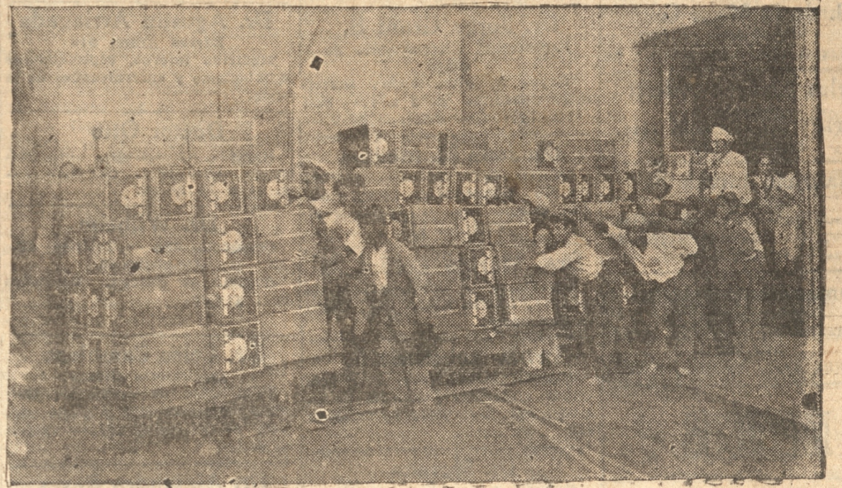
CARROS DE MANZANAS EN EL MOMENTO DE SER LLEVADOS AL MUELLE DE EMBARQUE

La cooperación del Gobierno ha sido eficaz y efectiva, a él se debe en gran parte la hermosa y plausible iniciativa de la Cooperativa Frutícola del