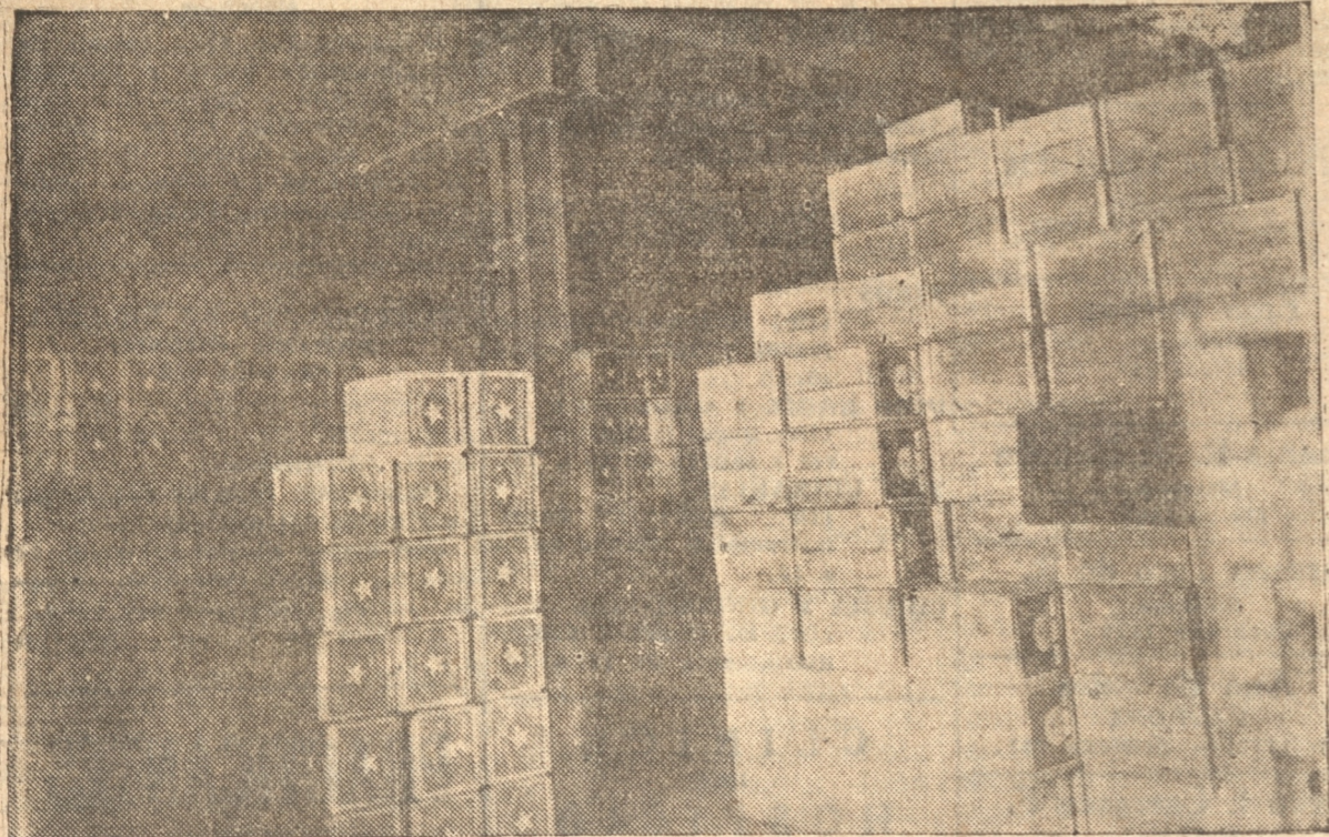
CANTIDAD DE CAJONES DE MANZANAS EN LAS BODEGAS ANTES DE SER EMBARCADOS

na con el desarrollo de la agricultura. Así lo ha demostrado en su representante el Ministro de Agricultura señor Luis Matte Larraín, quien ha expresado que no duda ni un momento