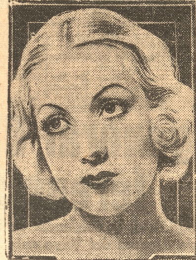
NOTA. - LA FUNCION VERMOUT, SERA DE LUJO Y NO SE DARA SERIAL

EL PECADO de los HIJOS Con un elenco formidable Luise Latimer - Lewys Stone Bruce Cabot - Betty Grable