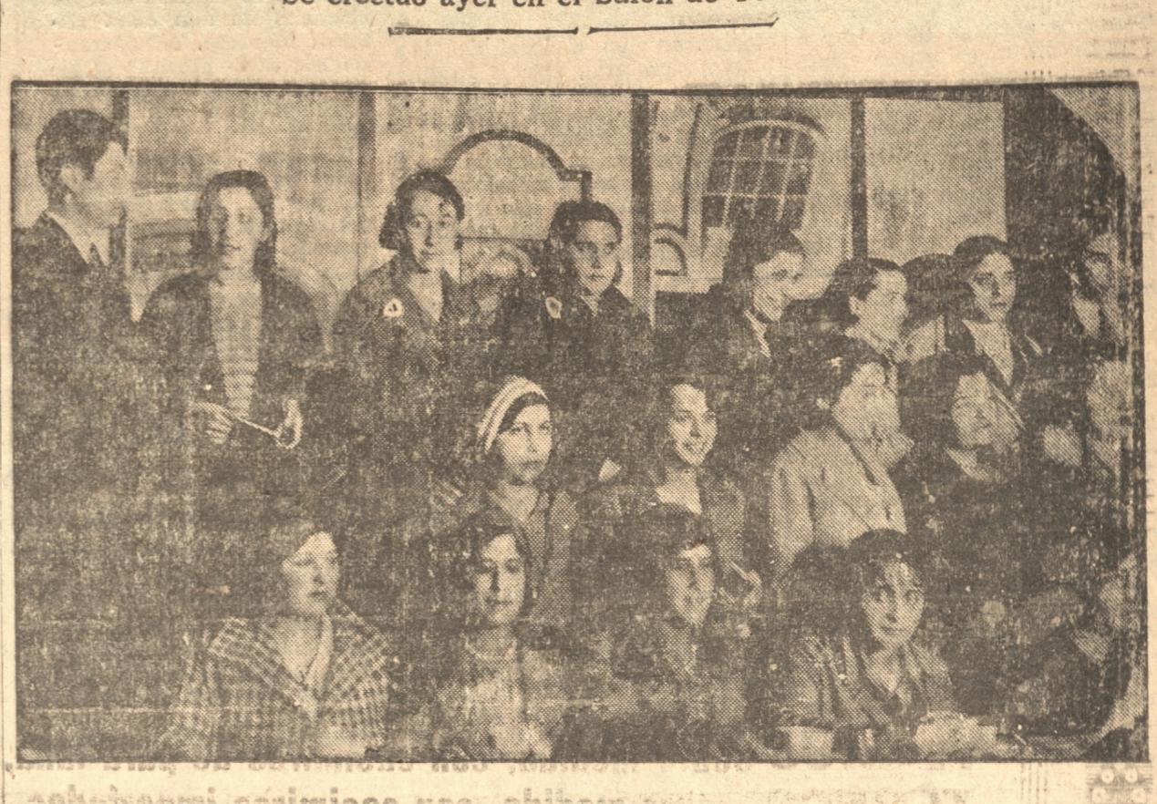
GRUPO DE ASISTENTES A LA MANIFESTACION ENTRE ALUMNOS DE FARMACIA

UNA MANIFESTACION ENTRE ALUMNOS DE LA ESCUELA DE FARMACIA Se efectuó ayer en el Salón de Té "Nuria"