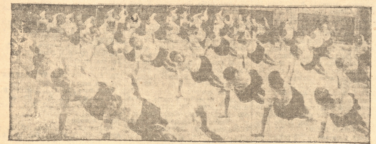
ALUMNINAS DEL LICEO FISCAL DE NIÑAS DURANTE LA REVISTA DE GIMNASIA

Esta tarde a las 15 horas se inaugurará la exposición escolar de este establecimiento