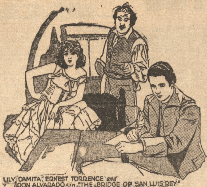
LILY DAMITA, ERNEST TORRENCE and DON ALVARADO in "THE BRIDGE OF SAN LUIS REY"

PRECIOS DE VERANO: Platea $ 4.40 Balcón $ 2.20