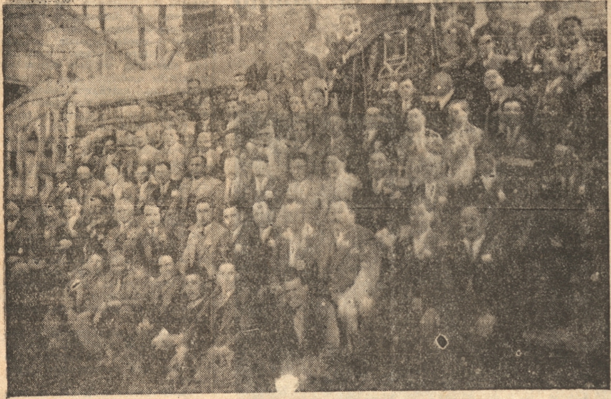
GRUPO GENERAL DE LOS ASISTENTES AL PASEO CAMPESTRE ORGANIZADO POR LA SOCIEDAD "GREMIO DE ABASTO", CON MOTIVO DE SU 29 ANIVERSARIO