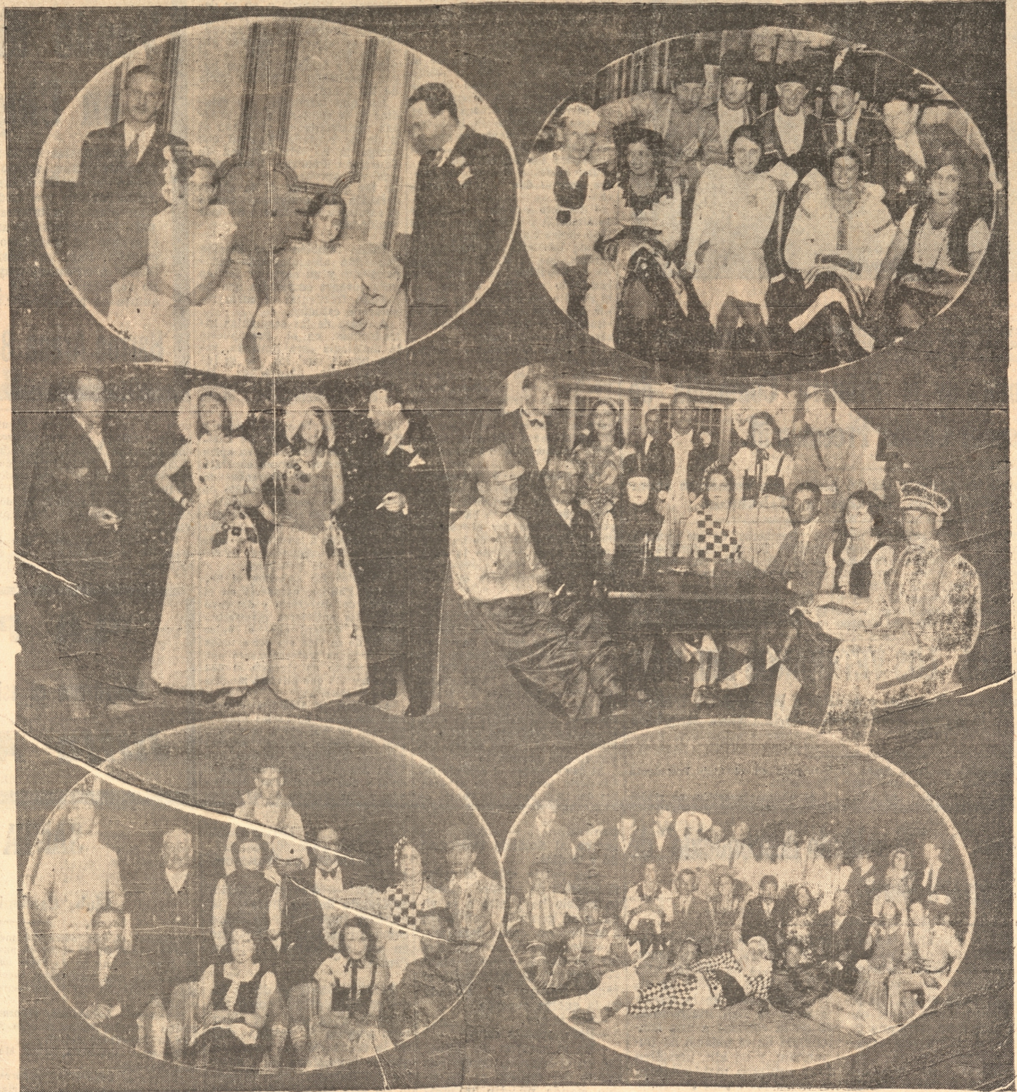
Diversos grupos tomados por Foto Venegas, durante el baile efectuado la noche del sábado en "El Morro" de Tomé