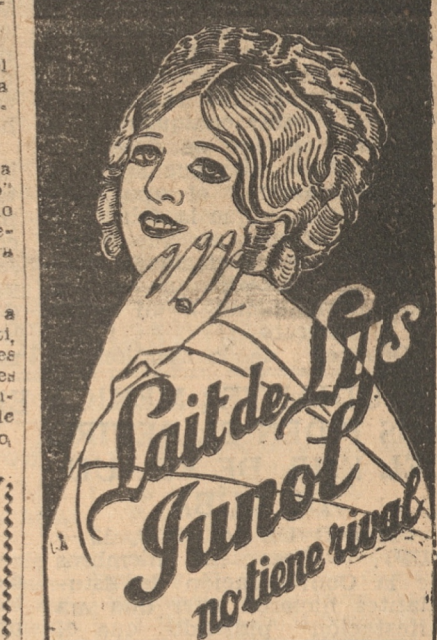
Lait de Lys Junol notiene rival

Para mañana anuncia el estreno de la Paramount "El Templo de las Hermosas" de la cual comedia que interpretan Gary Grant, Helen Mack y Genevieve Tobin.