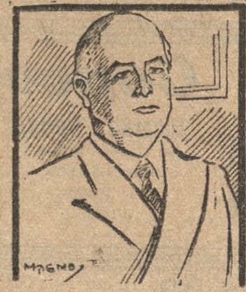
D. GABRIEL TERRA, Presidente de Uruguay

En seguida el presidente Terra declaró: "No hay más que para alarmarse; y descendí las escaleras entre los brazos de la multitud. Mu-