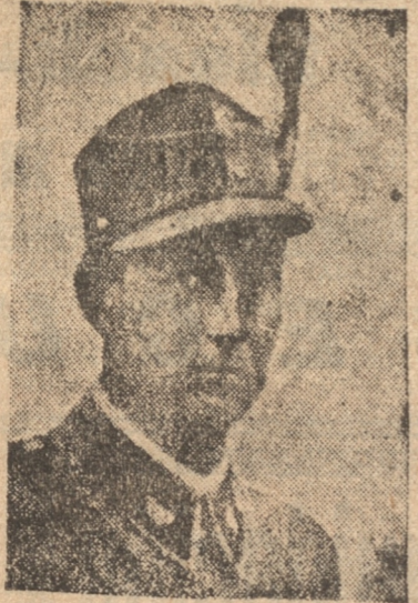
El Príncipe von Starhemberg

VIENA, 2. — (UP). — En otra parte de su discurso, el príncipe von Starhemberg dijo: "Debemos recordar aquellos días cuando empezó la batalla decisiva por el futuro de Austria, y aún, por su misma existencia. Sin exageración, la Reimwher era en aquel entonces el único factor de lucha".