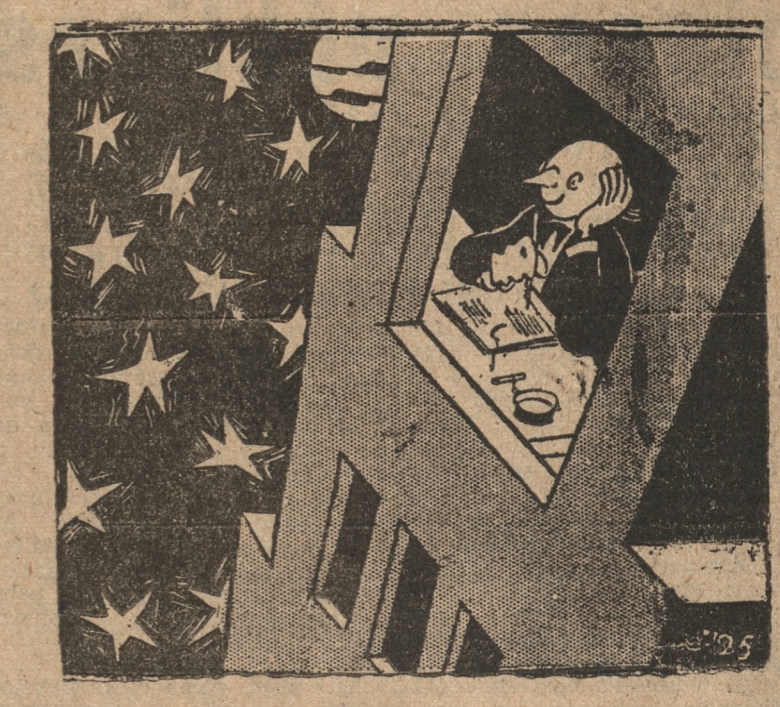
(De "El Romancero de Fipo").

Toda una verdadera leyenda será echada por tierra, con la próxima destrucción que se ha anunciado de la famosa chata "Liffey", actualmente anclada en