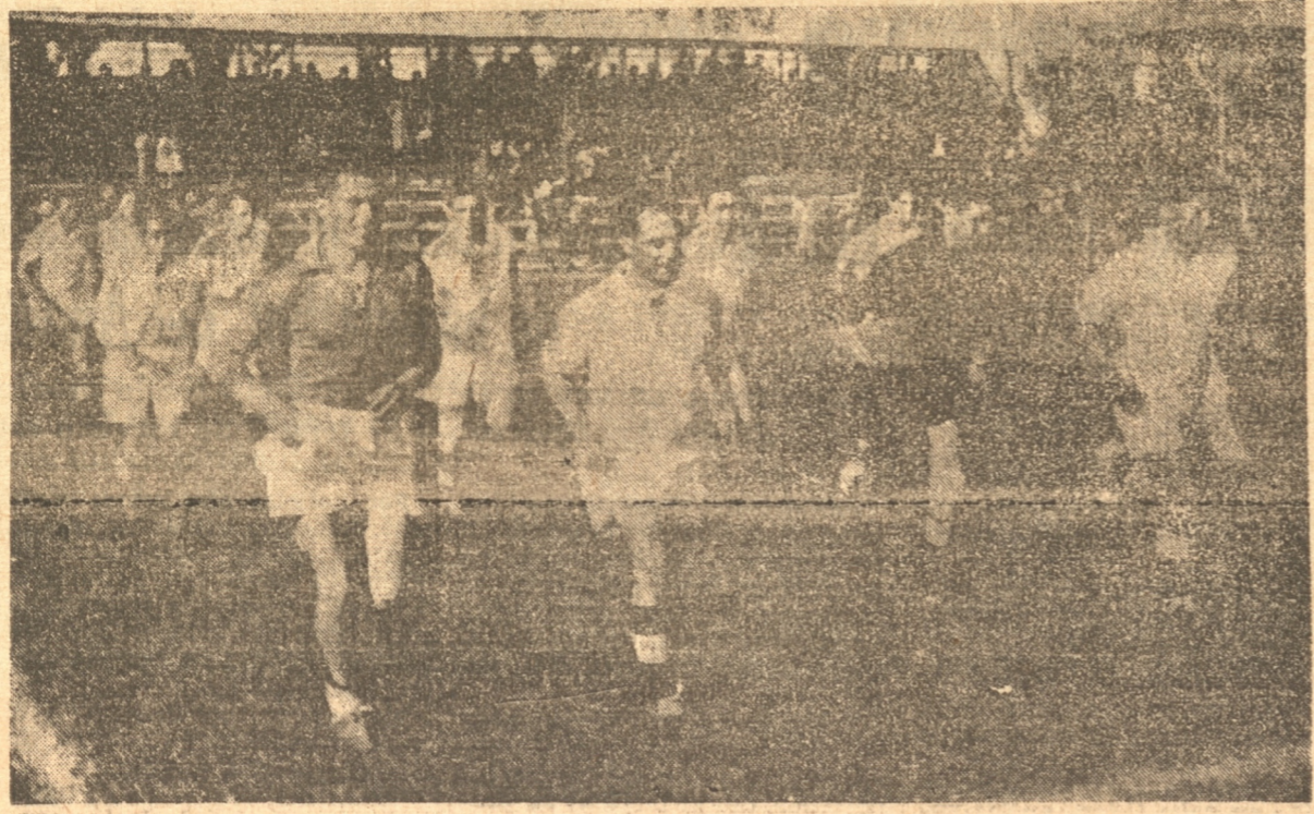
Los porteños salen ganosos a la cancha antes de golpear a los talquinos

Los triunfos de los albos han causado sensación. — Lo que nos relata nuestro corresponsal deportivo en la capital. — El match contra los iquiqueños. — Jugadores lesionados. — Colo Colo en jira al sur del país. Las grúas profesionales han empezado a funcionar