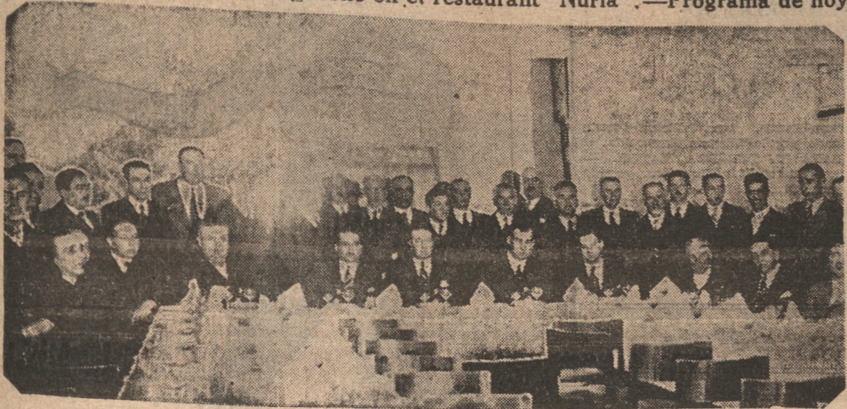
Grupo de asistentes a la comida de anoche en el restaurant "Nuria".

En la tarde arribó el senador don Gustavo Rivera Baeza, acompañado de su comitiva, en jira política. — Comida se le ofreció anoche en el restaurant "Nuria". — Programa de hoy