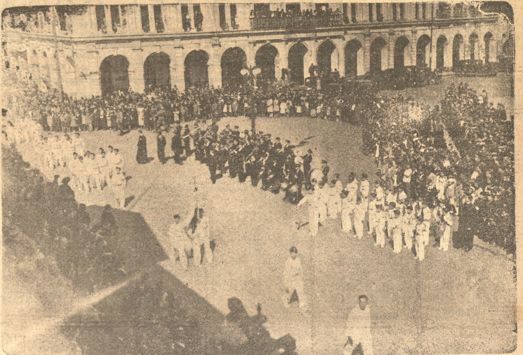
EL COLEGIO SALESIANO DE CONCEPCION, CON SUS BLANCOS UNIFORMES, ENCABEZA EL DESFILE. — ENFRENTA LA INTENDENCIA, ENTRE LOS APLAUSOS DEL PUBLICO.

LA PRESENTACION HECHA A MEDIODIA DE AYER POR LOS ALUMNOS DE LOS COLEGIOS SALESIANOS QUE SE ENCUENTRAN EN NUESTRA CIUDAD CON MOTIVO DE LAS FESTIVIDADES DEL CINCUENTENARIO DE LA FUNDACION DE LA CASA QUE LA OBRA DE DON BOSCO MANTIENE EN CONCEPCION, DIO OCASION PARA QUE SE DEMOSTRARA, EN FORMA PALPABLE Y ELOCUENTE, LA ORGANIZACION SOLIDA Y DISCIPLINADA QUE LOS HIJOS DEL GRAN PEDAGOGO SABEN IMPRIMIR A LOS ALUMNOS QUE SE EDUCAN BAJO SU CUIDADO Y SIRVIO TAMBIEN PARA EXTERIORIZAR LA SIMPATIA DEL PUBLICO ANTE UNA LABOR QUE POR TANTOS CONCEPTOS ES DIGNA DE TODOS LOS ELOGIOS. EN UN ACTO DE ESTA NATURALEZA, POCAS VECES LA CIUDAD HABIA PRESENCIADO UN ESPECTACULO TAN IMPONENTE COMO EL QUE OFRECERON MAS DE MIL NIÑOS, QUE CON SUS BANDAS DE MUSICOS AL FRENTE, PASARON ANTE UNA COMPACTA MULTITUD DESFILANDO EN FORMA IMPRECABLE Y CON SUS UNIFORMES QUE REALIZABAN EL ACTO CON ESPECIAL COLORIDO.