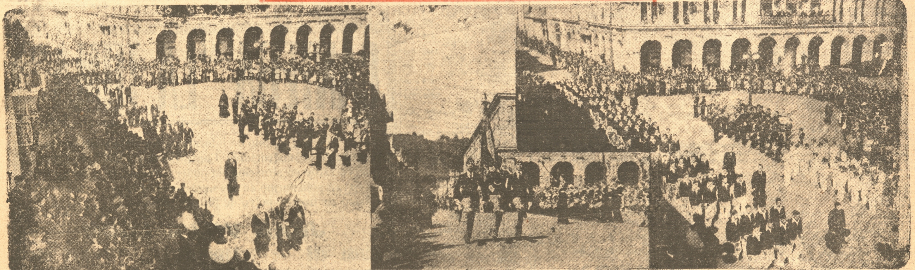
ASPECTOS DIVERSOS DEL BRILLANTE ACTO REALIZADO A MEDIODIA DE AYER EN NUESTRA CIUDAD. — LAS DELEGACIONES DE LOS COLEGIOS SALESIANOS DESFILAN CON SUS RESPECTIVAS BANDAS

Cálculos aproximados hacen subir a más de cinco mil las personas que se estacionaron en la Plaza Independencia y calles adyacentes, sin contar, naturalmente, al público que se encontraba a lo largo de las calles por donde debió pasar el desfile en columna.