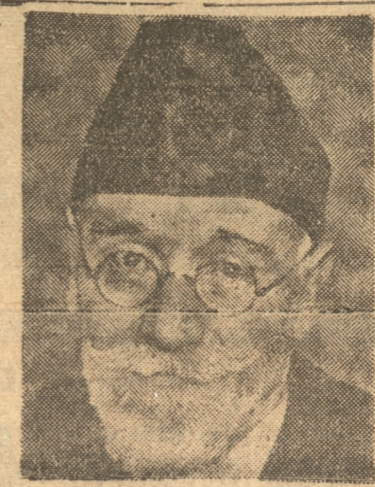
ELEUTERIO VENIZELOS Fue la figura más destacada de la actual política griega

Las oficinas de los diarios se ven asaltadas por grupos de gente que acuden a saber noticias de los diarios.