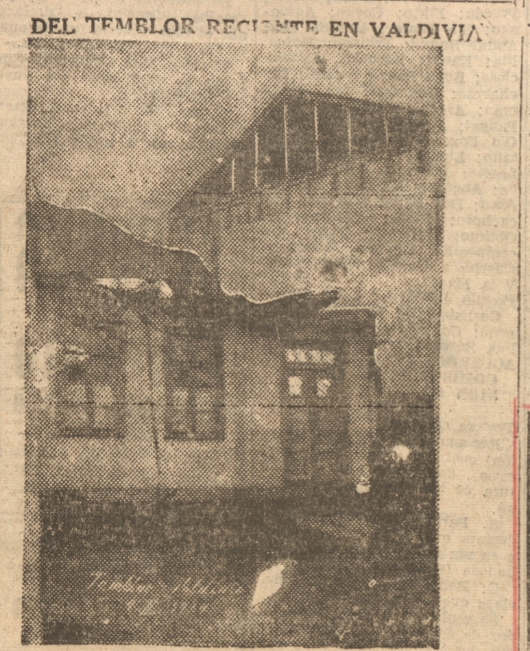
Edificio completamente agrietado y con el techo destruido a causa del temblor. (Información gráfica exclusiva para "La Patria", de nuestro correspondiente en Valdivia).

Costes aterrizó en aeródromo alemán WESTFALIA, 5.— (U. P.) — Costes aterrizó en el aeropuerto de Deladendhe, debido al mal tiempo reinante.