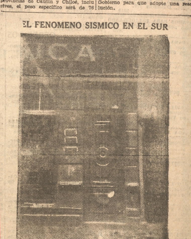
Estado en que quedó un edificio frente a la plaza principal de Valdivia. (Información gráfica exclusiva para "La Patria", de nuestro correspondiente en Valdivia).