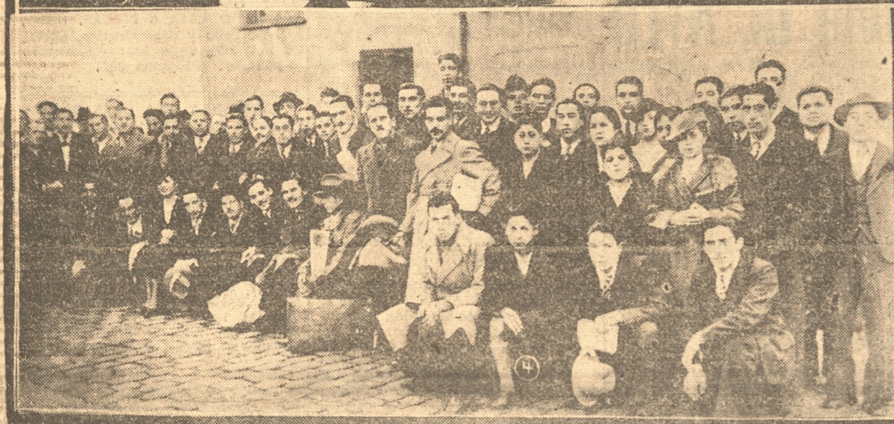
1) 3) y 4)—Aspectos diversos de la inauguración de la Convención de Profesores de Liceos Nocturnos. Puede verse la llegada de los delegados a la Estación, los asistentes al Vermouth de Honor y la presidencia del torneo. 2) El equipo del "Fernández Vial" que ayer venció en la competencia de apertura de la temporada de fútbol. — 5) "Victoria de Chile" que ayer cayó estrechamente derrotado ante "Fernández Vial"