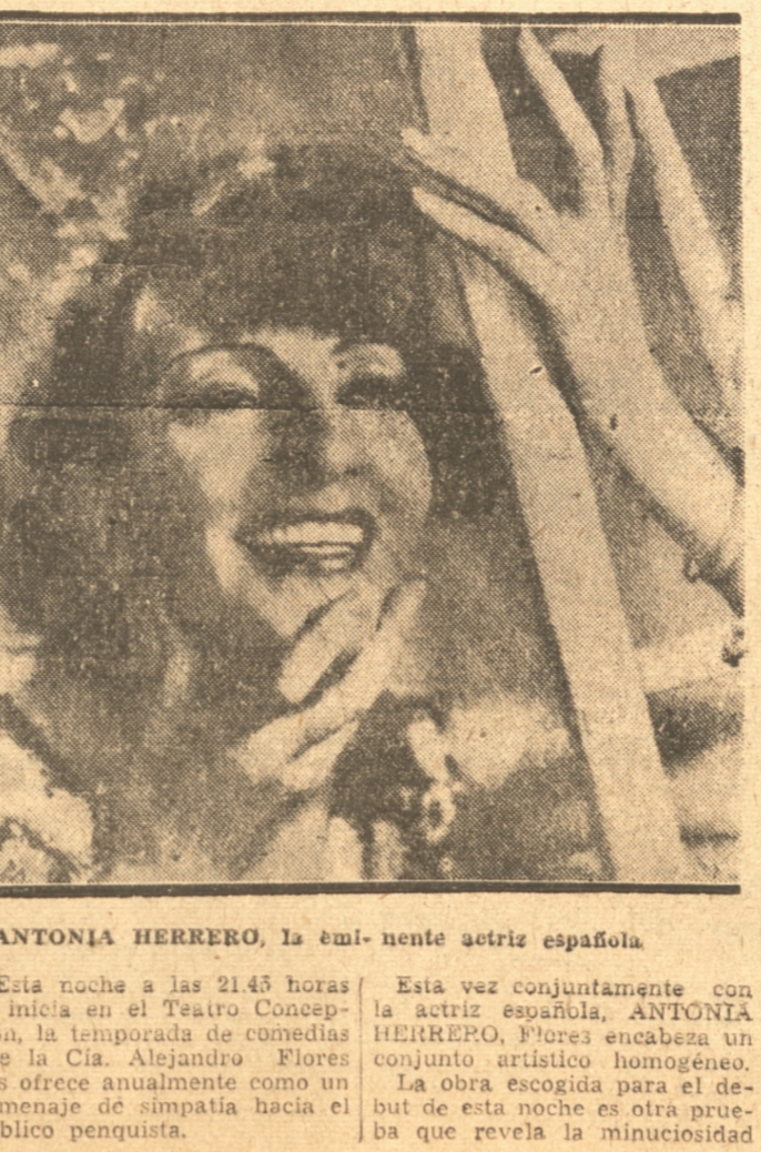
ANTONIA HERRERO, la eminente actriz española.

LOCALIDADES AGOTANDOSE EN LA CONFITERIA PALET