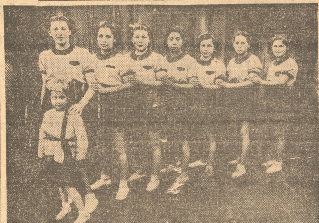
10 x 2 a favor del quinteto lotino.