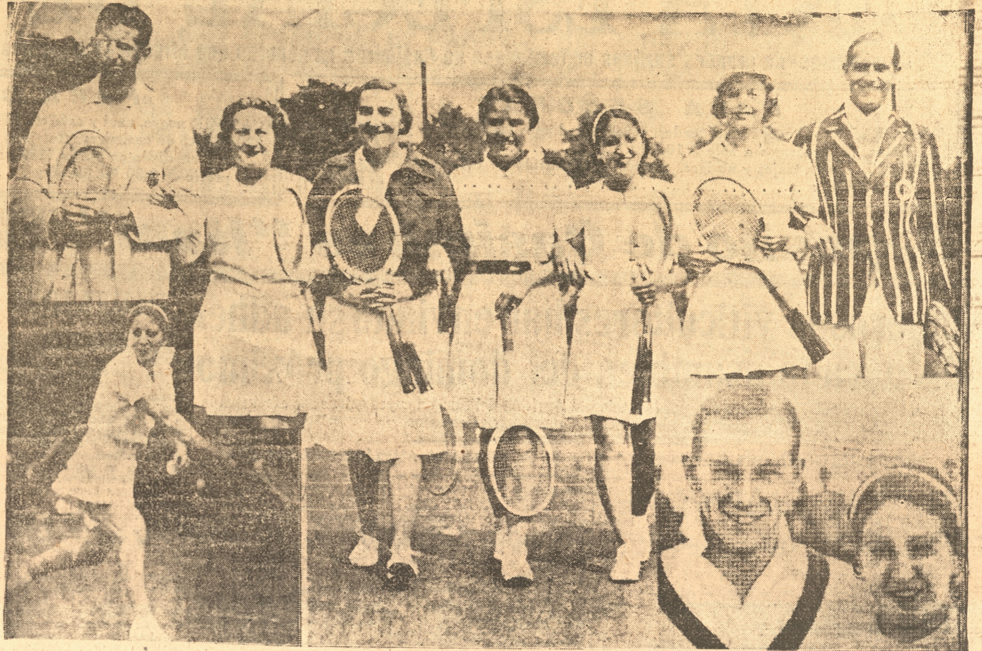
AQUI TENEMOS interesantes fotografías sobre Anita Lizana y que dicen claramente de la popularidad y gran prestigio que tiene la celebrada jugadora chilena