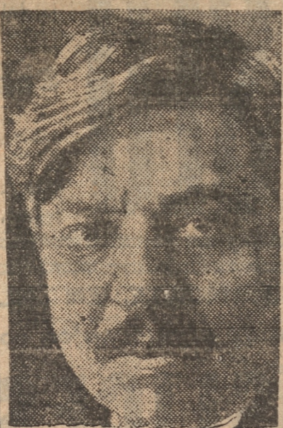
M. LAVAL, Canciller de Francia que participa en la conferencia tripartita

Se teme de un modo especial que la Pequeña Entente pueda enviarse y que movilice tropas en contra de una posible acción de Hungría, a continuación del peso dado por Alemania para romper las cláusulas militares de los pactos de paz, al crear un Ejército de conscripción.