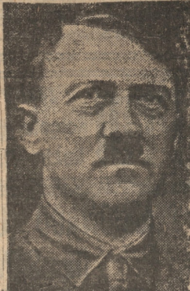
HITLER que está dispuesto a mantener el rearme de Alemania