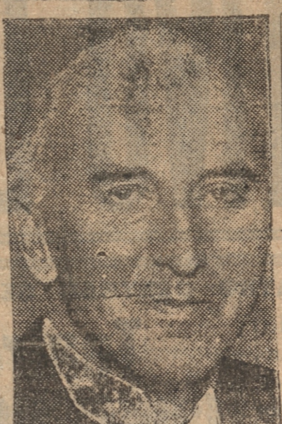
SIR JOHN SIMON iría a Berlín a conferenciar con Hitler

PARIS, 23. — (UP). — En la conferencia tripartita se discutió la acción francesa en Ginebra. Los británicos aconsejaron una política de moderación y que no se invogaran sanciones contra Alemania. Cuando el Consejo de la Sociedad de las Naciones escuche la denuncia de Francia de una posible acción de Hungría, a continuación del peso dado por Alemania para romper las cláusulas militares de los pactos de paz, al crear un Ejército de conscripción.