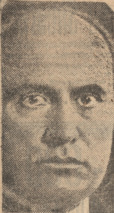
MUSSOLINI piensa formar Ejército de un millón seiscientos mil soldados

Se teme de un modo especial que la Pequeña Entente pueda enviarse y que movilice tropas en contra de una posible acción de Hungría, a continuación del peso dado por Alemania para romper las cláusulas militares de los pactos de paz, al crear un Ejército de conscripción.