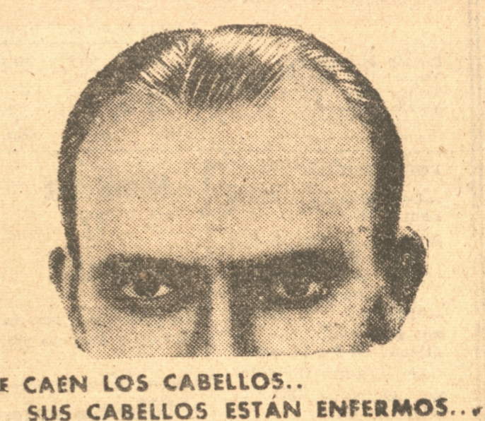
LE CAEN LOS CABELLOS... SUS CABELLOS ESTÁN ENFERMOS...

Hay que cuidarlos sin tardar a fin de evitar la calvicie que le acecha. Si tiene V. caspa, si le pica la cabeza, si tiene los cabellos demasiado secos o demasiado grasos y empiezan a caerse, es que tiene el cuero cabulludo enfermo. Hágase cada mañana una fricción de PETROLEO HAHN, que hará que se le pare rápidamente la caída del cabello y excitará el terreno para que broten de nuevo. El PETROLEO HAHN suaviza la cabellera sin volverla grasienta y permite dar al peinado la línea que se desea.