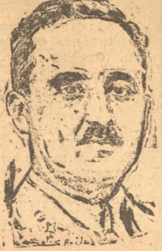
EL GENERALISIMO FRANCO

Los británicos temen que las operaciones de bombardeo sean preliminares a la ocupación militar de la ciudad por los japoneses de la cual depende para su existencia comercial la rica colonia de la corona británica de Hong Kong, situada sobre el río Pearl.