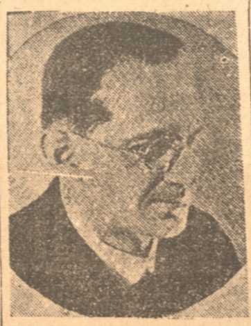
HENLEIN, el líder de los Sudetén alemanes en Checoeslovaquia

El contraste es fuerte, monseñor Hlinka dirige su campaña autonomista sobre el terreno religioso. Las masas de campesinos eslovacos, profundamente católicos desde hace tiempo, se inclinan a ver en la Bohemia un foco de herejía, y ese sentimiento no se atenúa