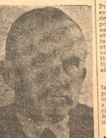
Cancellor Ceko que ha tenido destacada actuación en los acontecimientos de su país

bastante exactamente a la proporción de las fuerzas políticas de Eslovaquia. En las últimas elecciones legislativas de 1935, el block autonomista de Monseñor Hlinka aliado al pequeño grupo de los autonomistas polacos, obtuvo 489.641 votos.