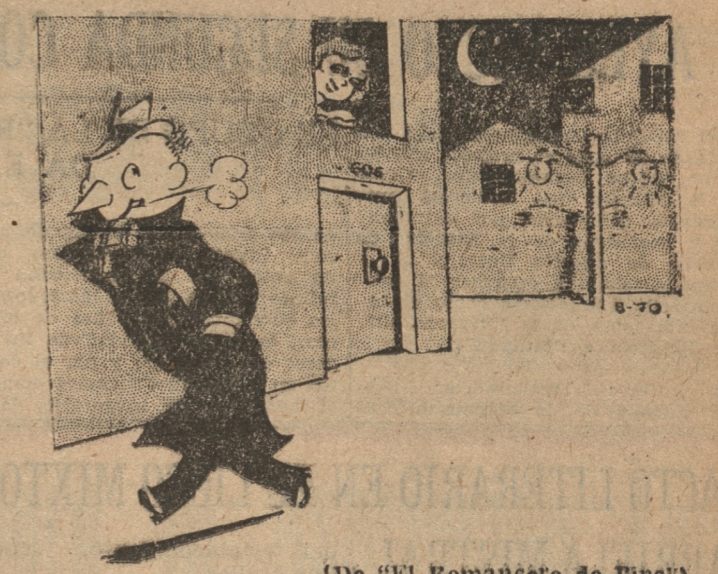
(De "El Romancero de Tipo").

En sesión secreta se trataron varias solicitudes particulares.