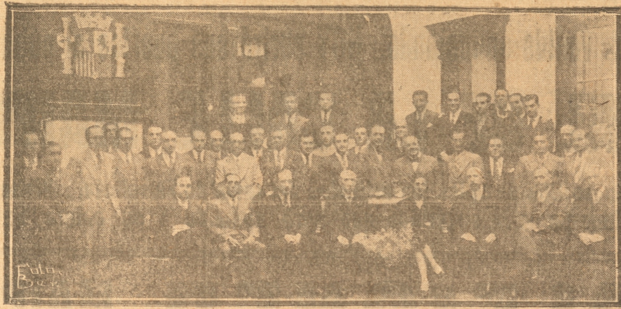
ASISTENTES AL VERMOUTH OFRECIDO AYER EN EL CENTRO ESPAÑOL, EN HONOR DEL POETA DON EDUARDO MARQUINA Y DE DOÑA MARIA GUERRERO

Apurar Cielos pretendo porque me traides así? Qué delito cometí contra los hombres naciendo? Calderón puso en esa obra inmortal toda la sabiduría que se puede concebir tras el estudio de la vida y, hoy como ayer, todo nuestro ser.