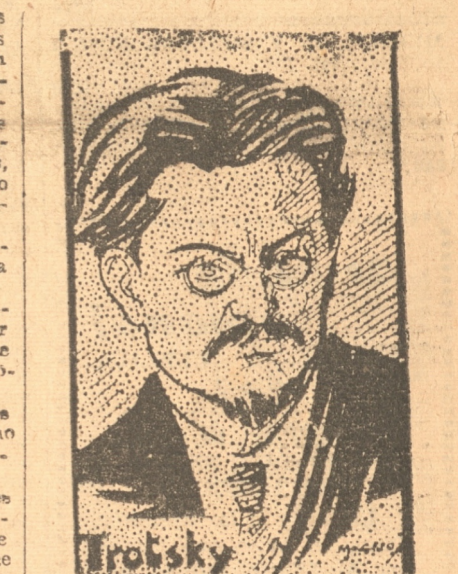
recolectó bajando la cabeza. La lengua de Vishinsky se desató en hábiles ataques contra Pistakov, Sokolov, Serebriakov y Radek, llamándolos banda de incendiarios, espías y bandidos.

MOSCU, 28. — (UP). — Al conocer la petición de pena capital hecha por el fiscal, Stroilov lloró, mientras que Pistakov se sostenía la cabeza con una mano. Redek en-