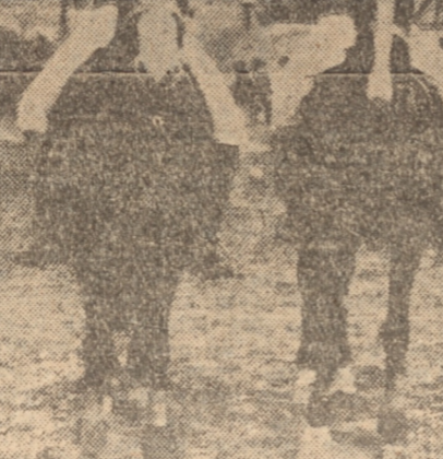
EL EQUIPO DEL REGIMIENTO GUIAS

Este campeonato se disputará durante el concurso hípico militar internacional que se efectuará en Viña del Mar, y podrán participar los teams afiliados a la Asociación de Polo de Chile en una competencia a 7 chukkers, por eliminación y con el handicap fijado por la Asociación de Polo de Chile.