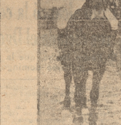
EL EQUIPO DEL REGIMIENTO GUIAS

Este campeonato se disputará durante el concurso hípico militar internacional que se efectuará en Viña del Mar, y podrán participar los teams afiliados a la Asociación de Polo de Chile en una competencia a 7 chukkers, por eliminación y con el handicap fijado por la Asociación de Polo de Chile.