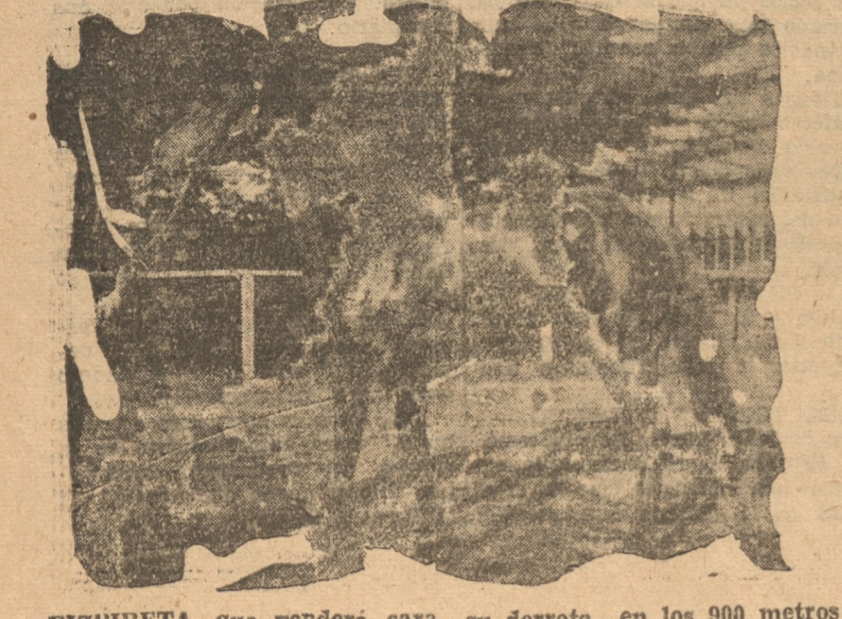
FIZPIRETA, que venderá cara su derrota en los 900 metros