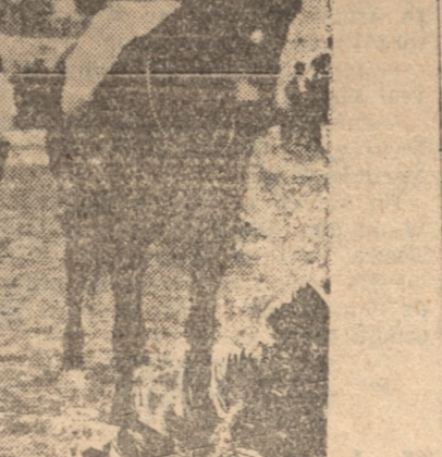
EL EQUIPO DEL REGIMIENTO GUIAS

Este campeonato se disputará durante el concurso hípico militar internacional que se efectuará en Viña del Mar, y podrán participar los teams afiliados a la Asociación de Polo de Chile en una competencia a 7 chukkers, por eliminación y con el handicap fijado por la Asociación de Polo de Chile.