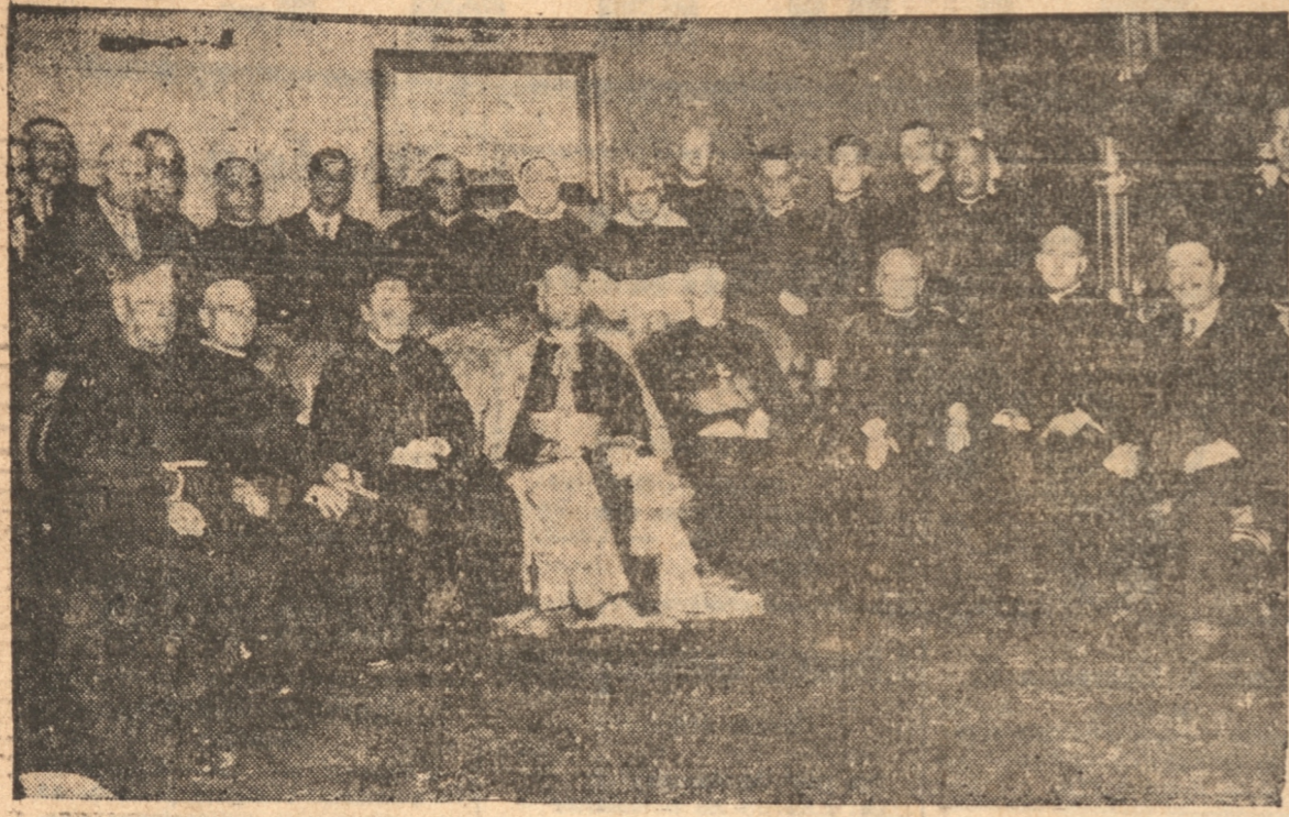
En la Sala Episcopal, rodeado de los miembros del clero y de un grupo de distinguidos caballeros

Alzad, pues, vuestra diestra y haced descender sobre este pueblo que os aclama, las bendiciones del cielo y la de que sois portador de parte del Augusto Soberano de la Iglesia, Su Santidad Pío XI.