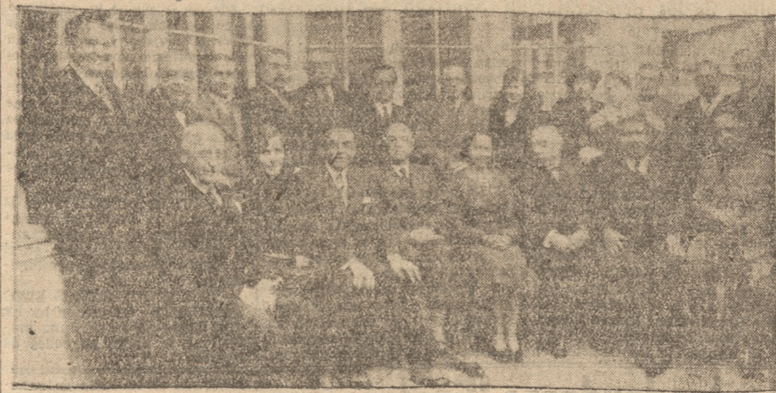
ASISTENTES A LA RECEPCION EN EL CONSULADO ARGENTINO

BRILLANTE REUNION SOCIAL FUE LA RECEPCION OFICIAL EN EL CONSULADO DE LA REPUBLICA ARGENTINA. — ASISTIERON EL INTENDENTE DE LA PROVINCIA, EL ALCALDE, CUERPO CONSULAR, ETC. — OTROS ACTOS EFECTUADOS